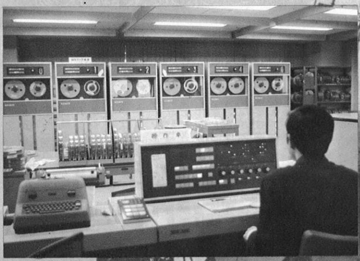
情報機能として活躍する電子計算センター

施設の整備はいつそう拡充されていく。また、卸売機能の強化や流通センターの建設を進めるほか、行政、経済に関する情報機能を充実していく。