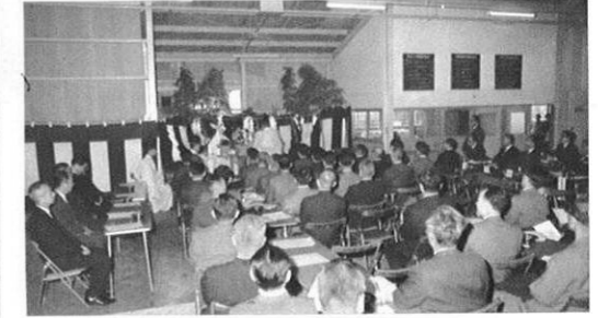
5.2) 県茶業試験場の新庁舎と製茶工場が完成。製茶試験室やオートメーションの新鋭機械が導入された。