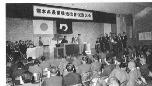
6.3) "70年代の豊かな農村を築こう"のスローガンを掲げて県農業構造改善大会が開かれ「第二次」への意欲を示した。