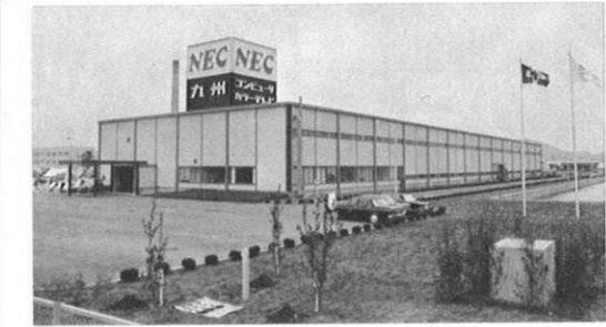
5.12) 熊本市八幡町に進出した九州日本電気が落成。花形の電子産業の「きれいな工場」としてスタートした。

県政ハイライト★KENSEI HAI RAITO★けんせいはいらいと★県政ハイライト★