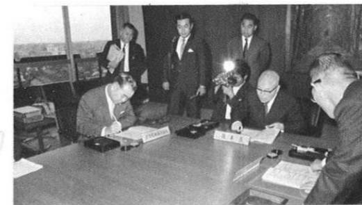
5.23) 玉名郡長洲町地先への日立造船有明工場進出がきまり調印式が行なわれた(知事応接室)