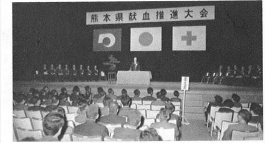
5.8) 県献血推進大会が開かれ、献血の運動推進協力者及び優良事業所、学校、市町村などに感謝状が贈られた。