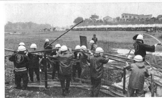
5.20) 雨期を前に、恒例の県総合防災訓練が、白川水系でいっせに行なわれた。訓練とは思えぬ真剣な活動ぶりだった。