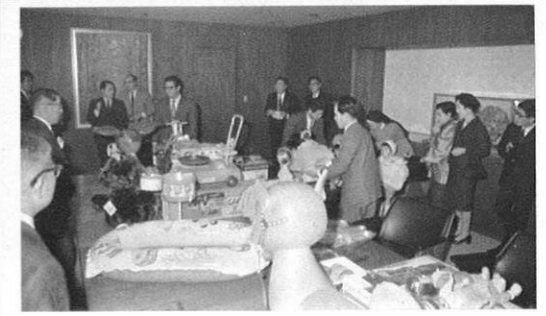
4.30) 東京人形ガン具組合から、県内の養護施設の子どもたちへ色とりどりのおもちゃがプレゼントされた。