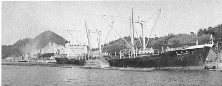
▲貿易の拡大をはかるため、港湾の整備をすすめる。