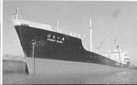
▲八代外港地区の工業用地、八代外港の建設をさらに促進

有明、八代の臨海部と熊本周辺の内陸部の工業立地をすすめるため、港湾、道路などの交通網や、工業適地の整備をはかり、九州中央工業地帯の形成をはかっていく。