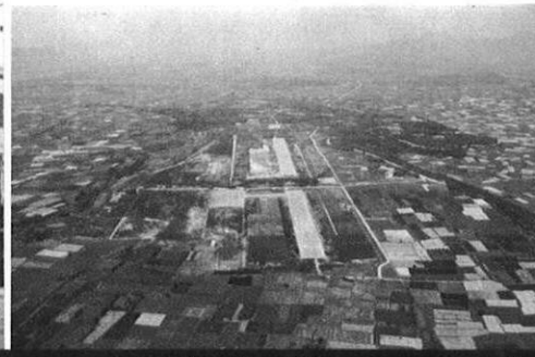
▲来春開港を前に建設たけなわの新空港