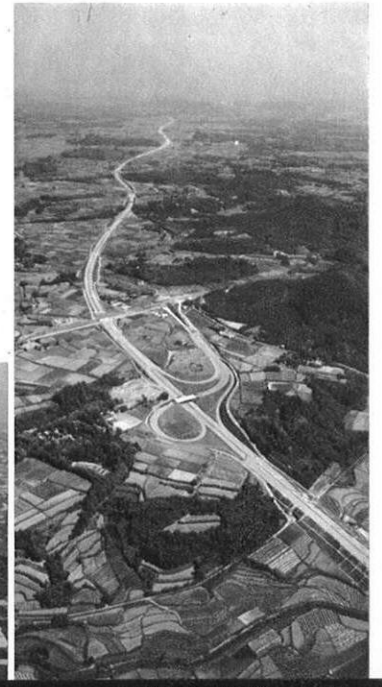
▲九州縦貫自動車道の建設も急ピッチに（植木インター付近）

新熊本空港、九州縦貫自動車道、九州新幹線鉄道など、高速交通網の整備と中枢都市熊本の開発を進めることによって、大都市地域との経済交流を緊密にしていく。