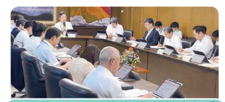
「こどもまんなか熊本」推進本部会議