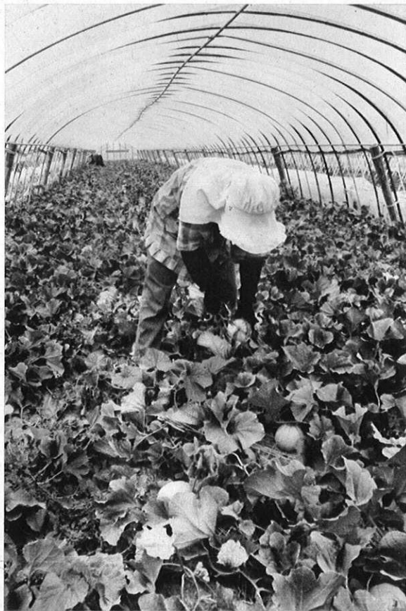
▲熊本のプリンスメロンづくりは、作付面積や生産量の面で全国第一位にのしあがった。