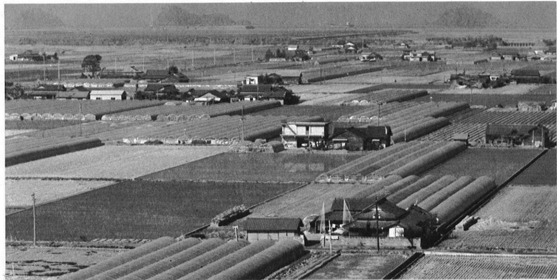
▲野菜づくりも大規模化し、技術化し、きびしい市場流通にたえる産地体制が真剣に考えられている。