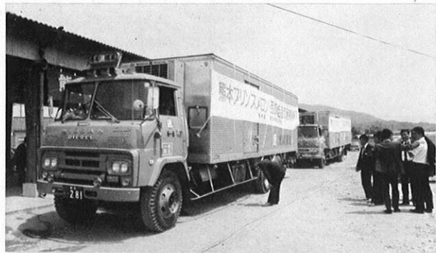
▲プリンスメロンは、品質と鮮度を保つため京浜や北海道向けにはコールドチェーン（低温輸送）による方法も開発しつつある。