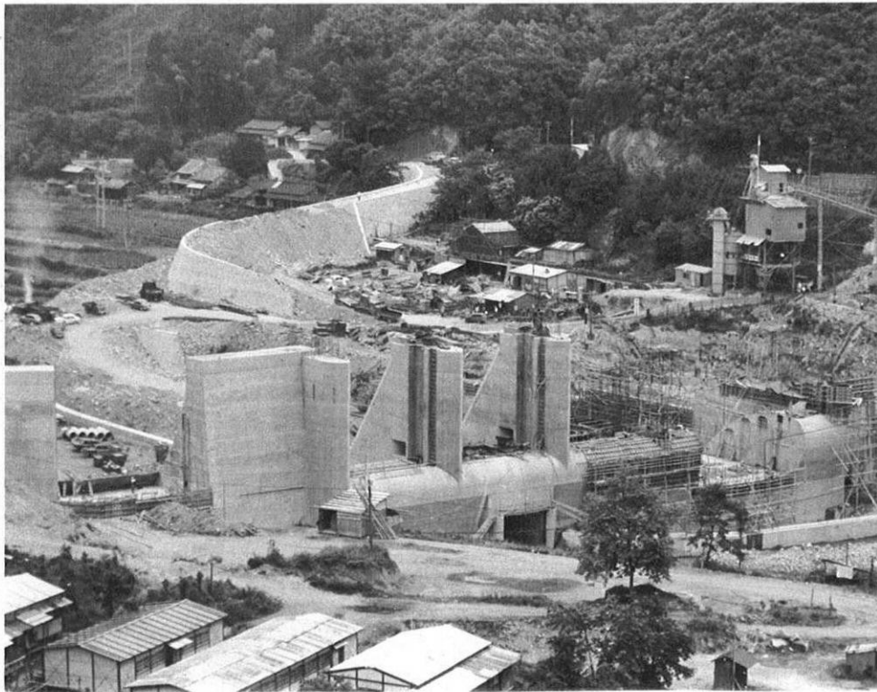
左・ダムの下流には県営第二発電所の建設が着々と進められている