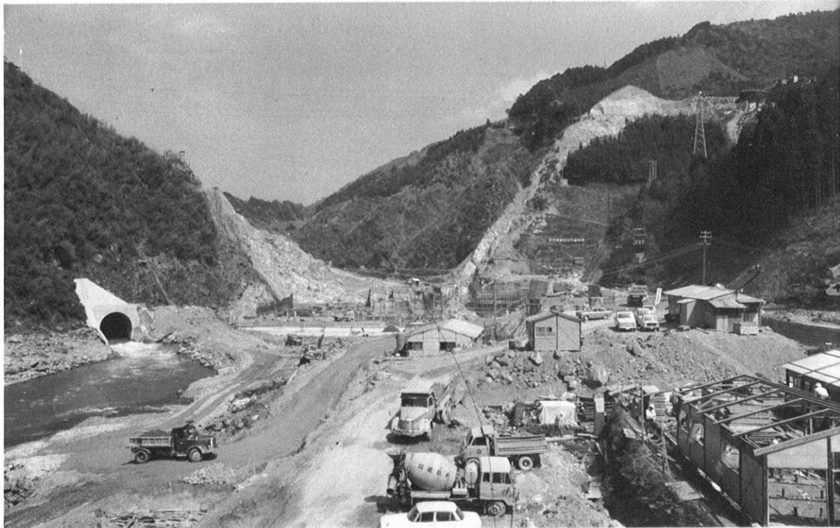
上・緑川ダム建設地点の展望