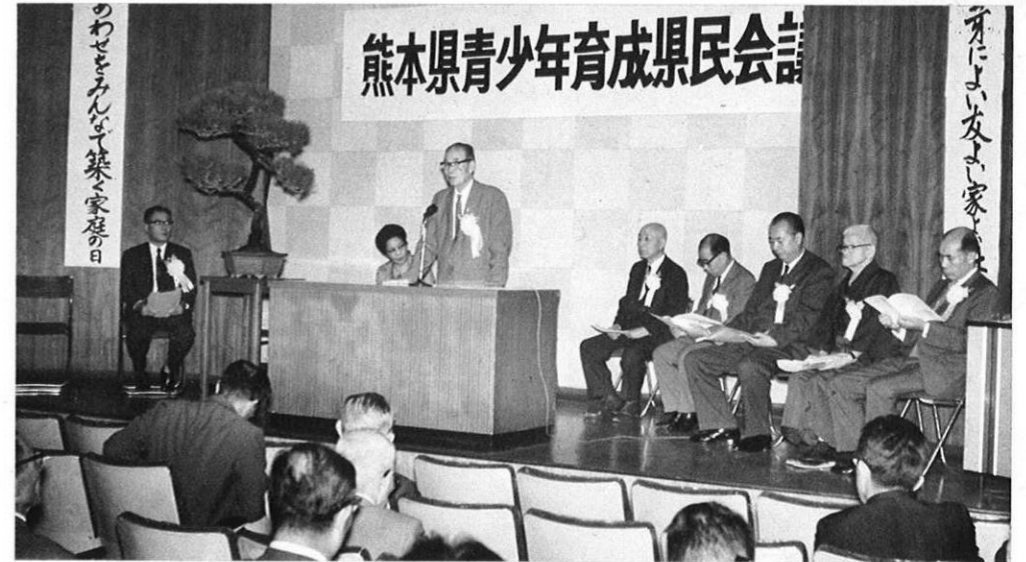
上・県民こそって青少年問題を理解し、青少年とともに前進しようと昭和41年11月青少年育成熊本県民会議が結成された。