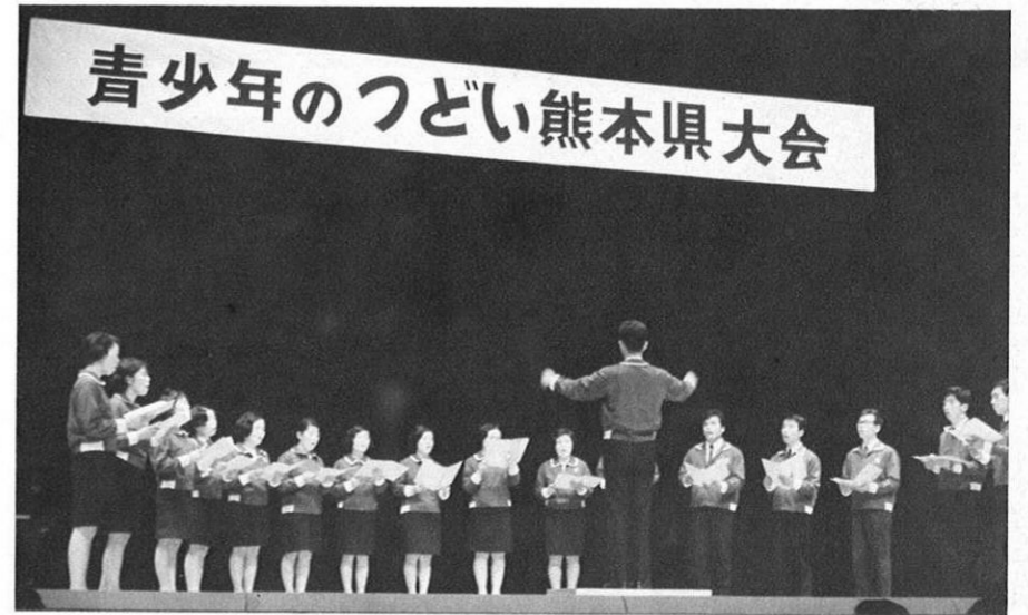
上・青少年のつどい県大会——和やかな交流、そして新たな結末が……。