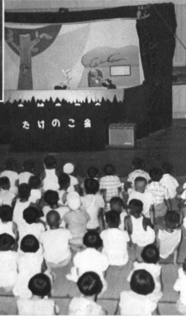
右・辺地の会場で人形劇は大うけ。