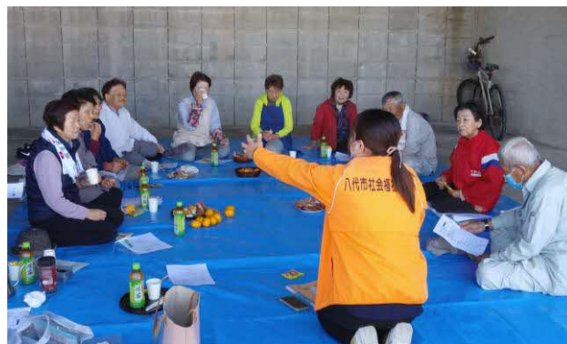
集まりの場所（倉庫）で説明