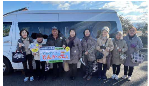
実証実験試乗会の様子

鏡町は平成17年に1市2町3村で合併をした1つ。 人口：13,751人、高齢化率：35.9%(R7.11末時点)の平野部。 面積が広く、町の中心部には生活に必要な機能が集中している一方、離れた地域では店や公共交通機関等が整っておらず、生活環境に差が生じている。 また、町の中心部までの移動手段が限られているため、住民にとってアクセス面が課題となっている。