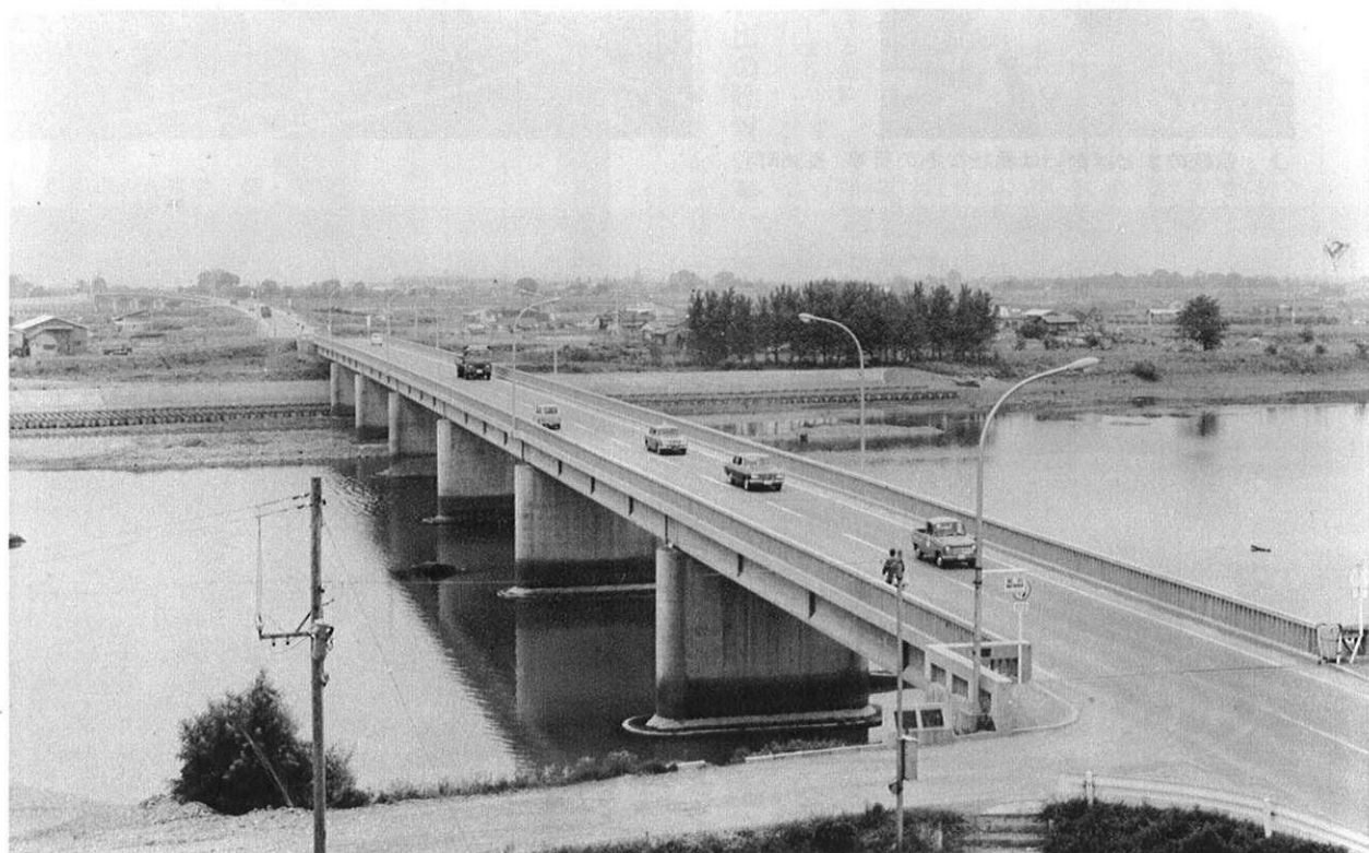
上・橋も永久橋に…球磨川にかかる白鷺橋(手前)と夕葉橋(後方)。