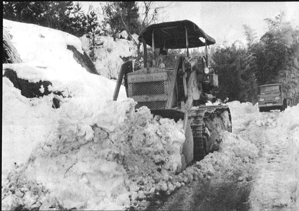
上・阿蘇地方では、冬は雪とのたたかいが続く。 路面の積雪をブルドーザで除く作業も並みだいでない。