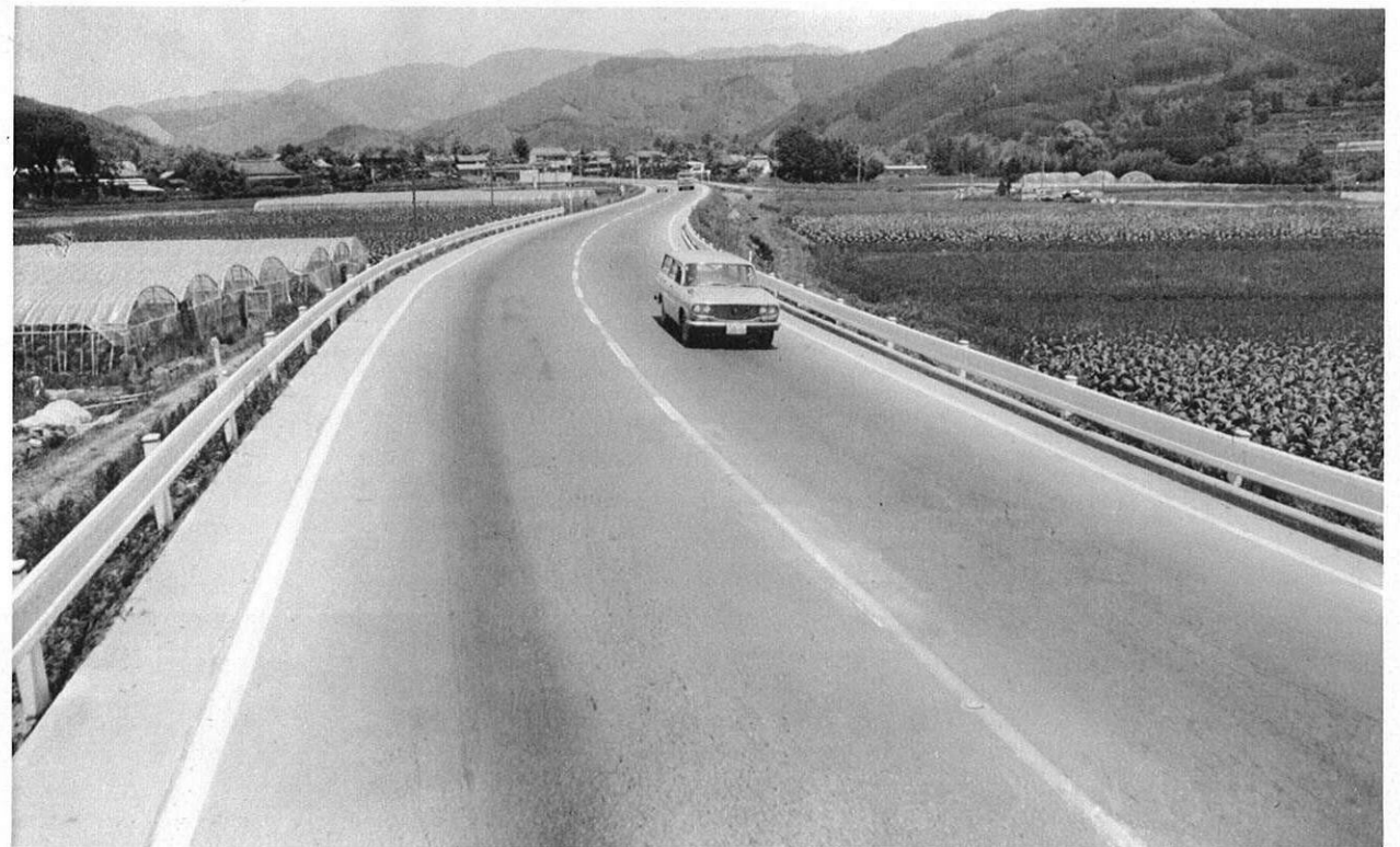
上・県内を南北に縦に走る動脈幹線道路—国道3号線。この道路も最近交通量が激増してきた。