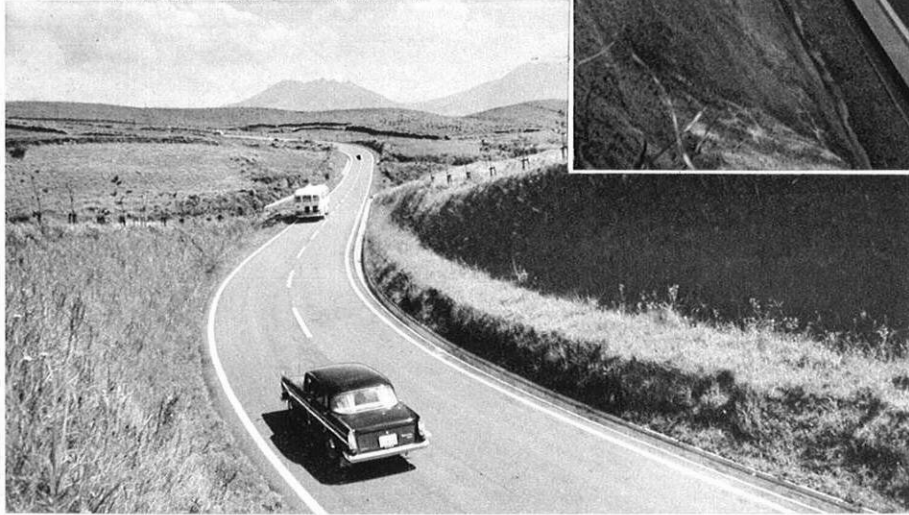
下・阿蘇観光の動脈—九州横断道路