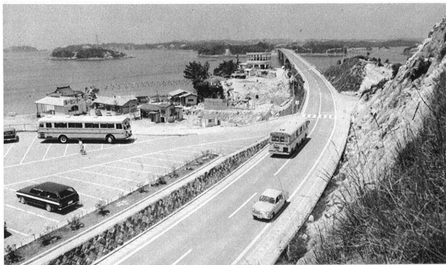
左・整備された天草五橋関連道路。