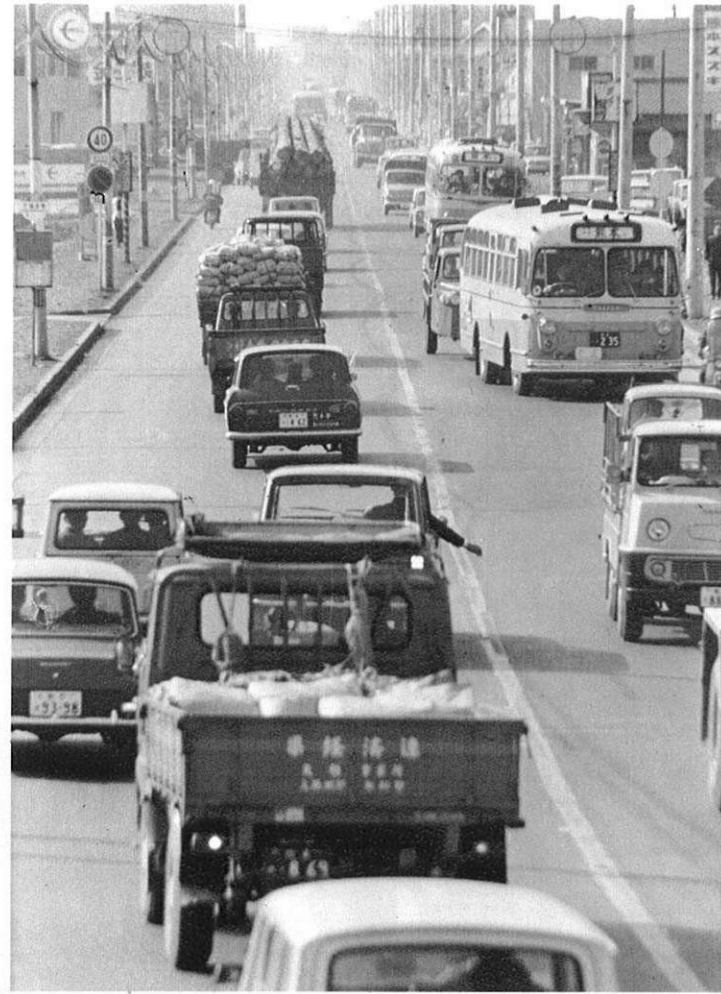
左・最近の自動車のふえ方はすさまじいばかり、とくにトラックの発達は著しく、早くて便利な輸送機関としてますます活発になつてきている（熊本市内）