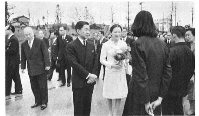
上・盲学校の生徒をはげまされる皇太子ご夫妻（県庁にて）

このあと、熊大理学部臨海実験所で、有明海や八代海の魚介類のご説明をお聞きになったご夫妻は、お車で天草五橋をお渡りになって三角へ。午後三角駅から熊本駅に向かわれ、熊本駅で上り急行霧島にお乗り換えになり、熊本をあとにされた。