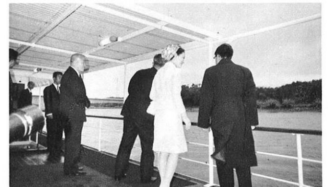
上・お召船から天草五橋や天草松島等をご見学になった。