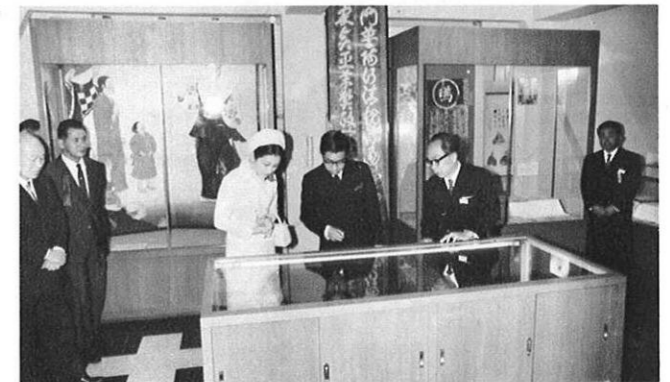
上・天草切支丹館では熱心に展示品をご覧になった。