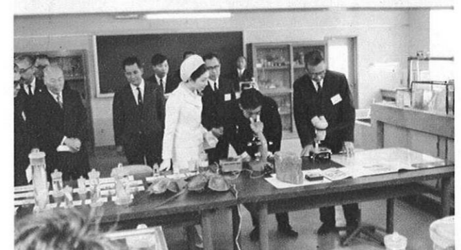
上・熊大理学部臨海実験所で顕微鏡をご覧になるお二人。