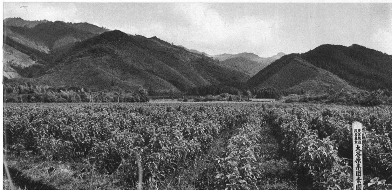
下・球磨郡錦町大谷原の集団桑園。