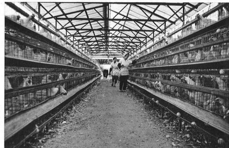
右・鹿本地方ではマンモス養鶏がさかん。