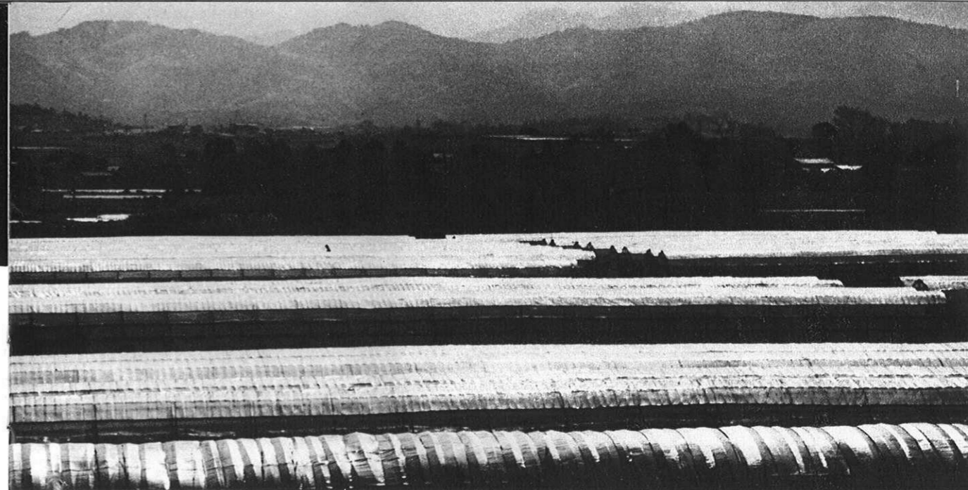
〈注〉写真は農業構造改善写真コンクール入選作品