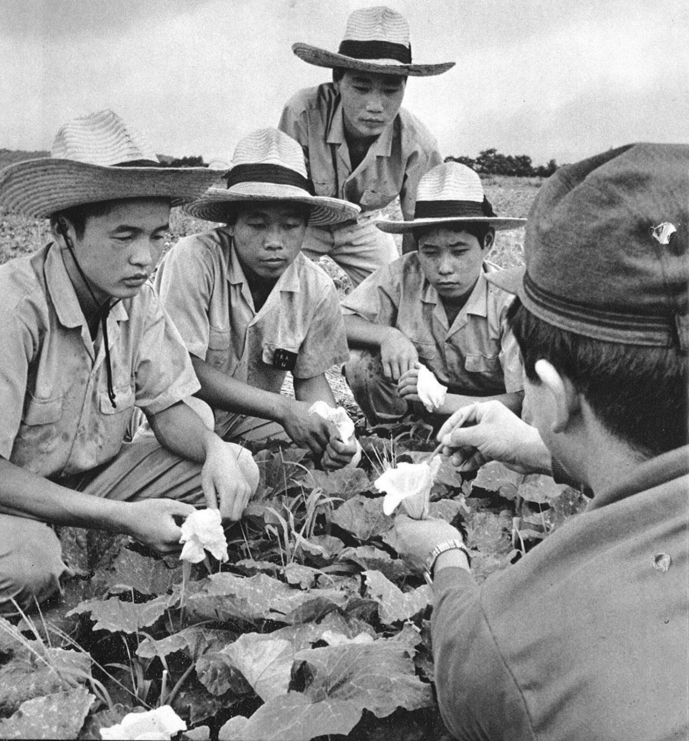
指導員のいる風景 (その2)