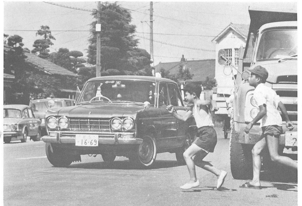
ゼロの日のための願い <その7>