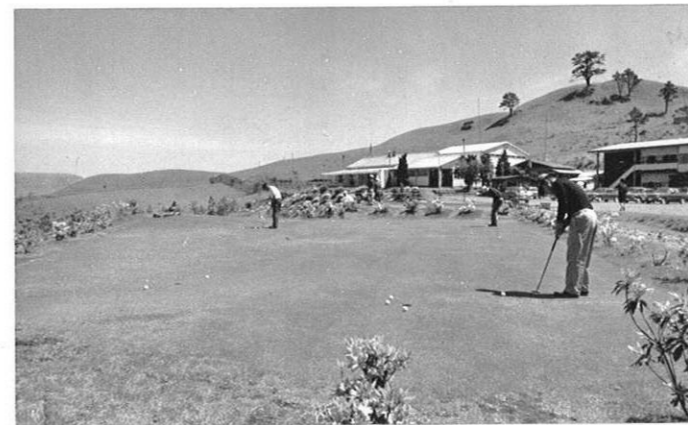
上・雄大な五岳を背景にゴルフを楽しむ観光客も多くなっている。