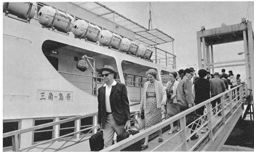
左・熊本を訪れる外人観光客も多くなった。