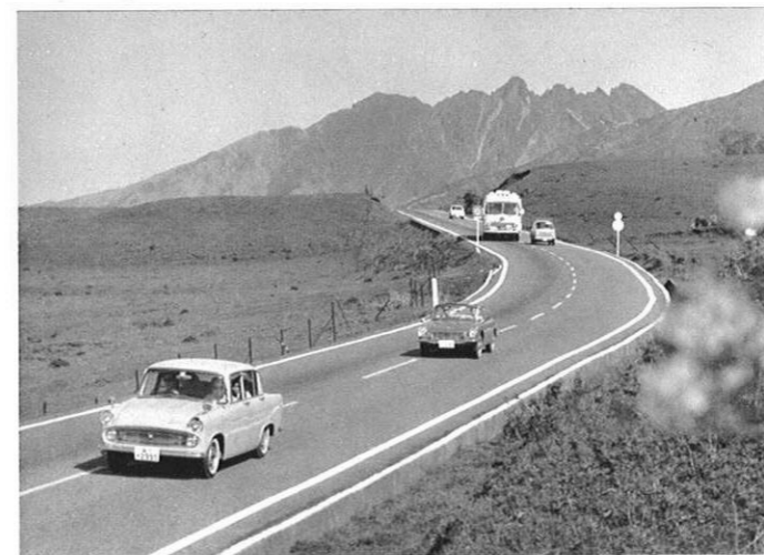
上・九州横断道路を経て、阿蘇登山というコースは新しい魅力となった。