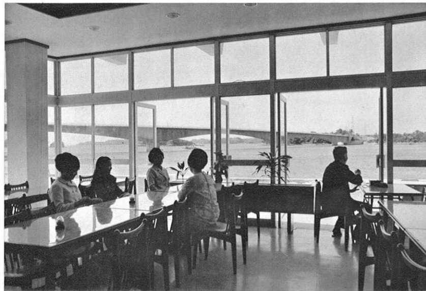
左・昨年秋にオープンした国民宿舎「松島苑」海沿いのロビーからは天草五橋が手にとるように見える。