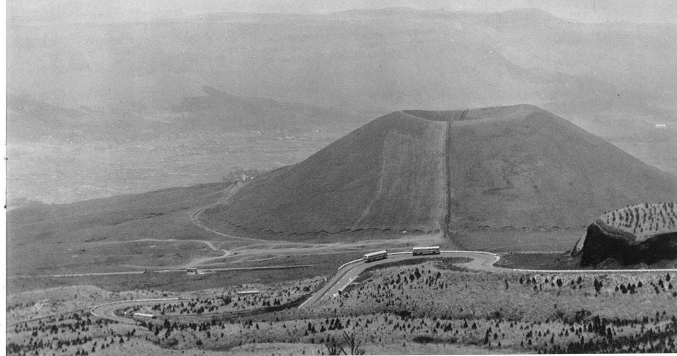
上・熊本市と阿蘇山上を短距離で結ぶ県営阿蘇山観光有料道路は、美しい米塚の裾を横切っていく。