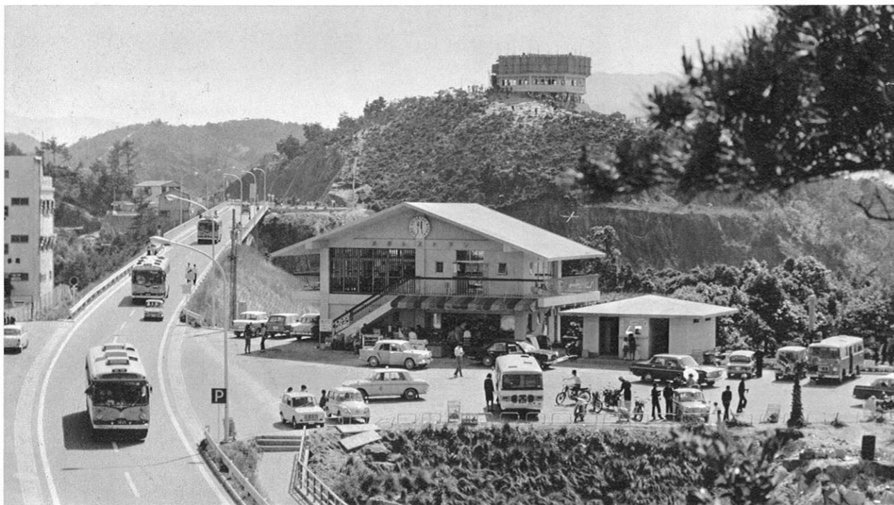
上・天草パールラインの開通でマイカー族は急速に伸び、駐車場も着々と整備されている。(五号橋附近)