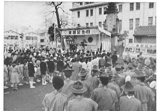
上・(2.11) 初の建国記念日を祝って各地で祝賀行事やパレードが……。(写真は熊本市内)