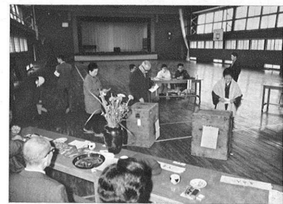
上・年明けとともに県知事選挙(1.15)に次いで衆議院議員選挙(1.29)が行なわれた。