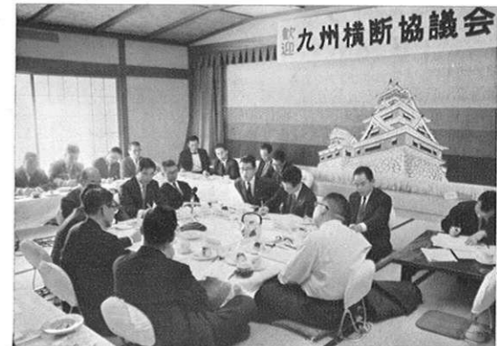
上・(1.25) 熊本、長崎、大分各県の観光関係者代表による九州横断協議会ひらく。