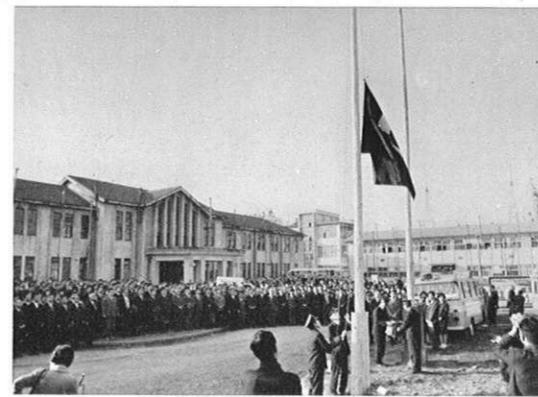
上・(3.2) 20年間活躍した旧県庁舎とお別れの離庁式。感慨ひとしおの中に県旗降納。