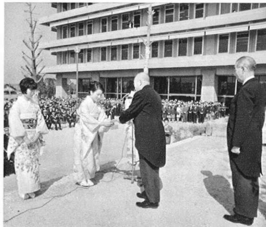
上・(3.3) 新県庁舎の開庁式。神事のあと、簡素をモットーにいろいろの祝賀記念行事も。