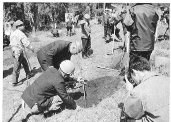
上・(3.1) 寺本知事もひと役かって……。緑化行事の一環として、恒例の記念植樹が金峰山麓で行われた。

県政ハイライト・県政ハイライト・県政ハイライト・県政ハイライト・県政ハイライト・県政ハイライト・県政ハイライト・県政ハイライト・県政ハイライト・県政ハイライト