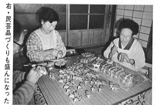
右・民芸品づくりも盛んになった