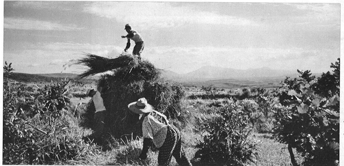
左・阿蘇の風物詩となった「刈り干し切り」