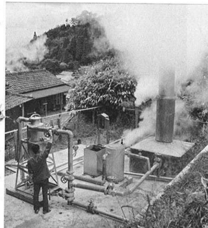
上・脚光を浴びつつある、阿蘇地熱資源の開発。 (阿蘇郡小国町)