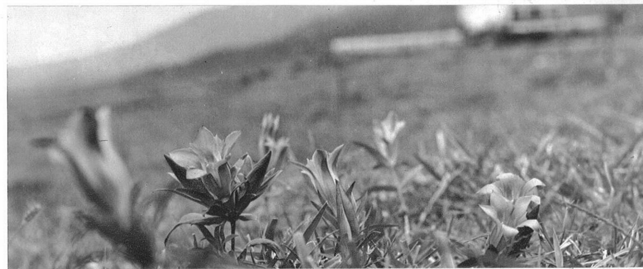
左・阿蘇東口登山 道路につながるロープウェイ 仙酔峡が眼下に雄大な展がりを見せる。 下・高原に咲き乱れるりんどうの花