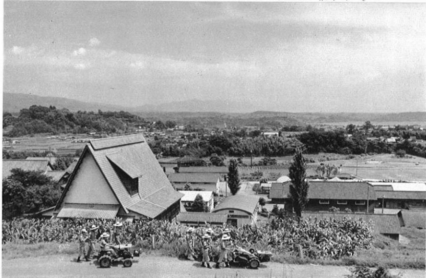
(写真は熊本県経営伝習農場菊池農場)

城北地区は玉名平野や菊池平野などの豊かな農地基盤が拡がり、これらの開発により農業近代化の構想は着々と進められている。また新産地域としての都市工業化への努力とともに、九州縦貫高速自動車道の建設により、他地域との経済交流も一段と活発になることが予想されている。