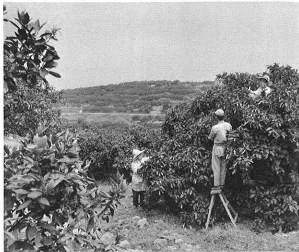
上・小天みかんで名高い天水町の果樹栽培。 下・玉名平野のかんがい用水のポイント、白石堰。