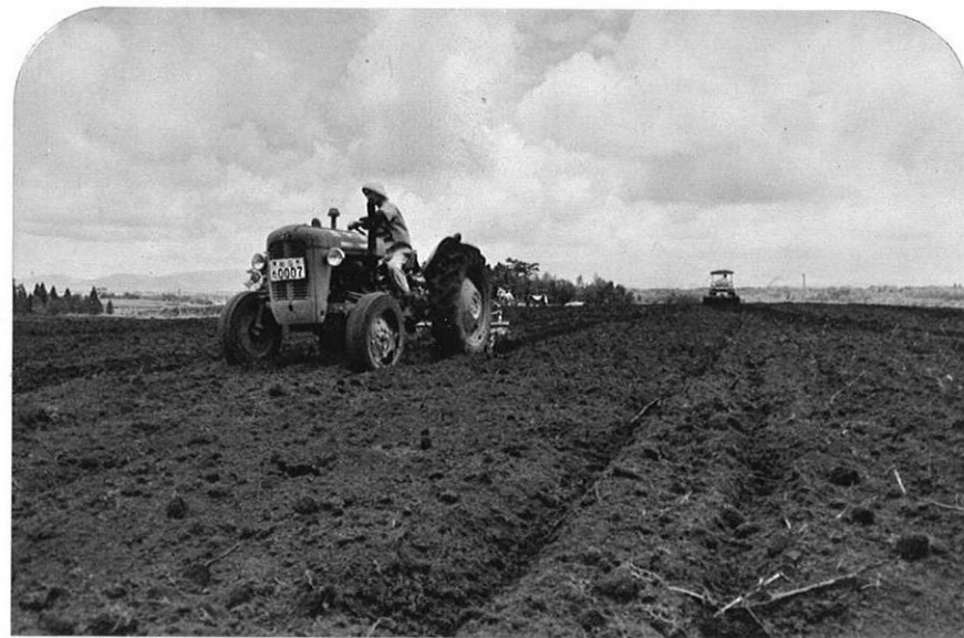
上・菊池台地では雑木林をひらいて農地造成が活発に行なわれている。 下・農村人づくりの基地としての県経営伝習農場が菊池市と植木町に。