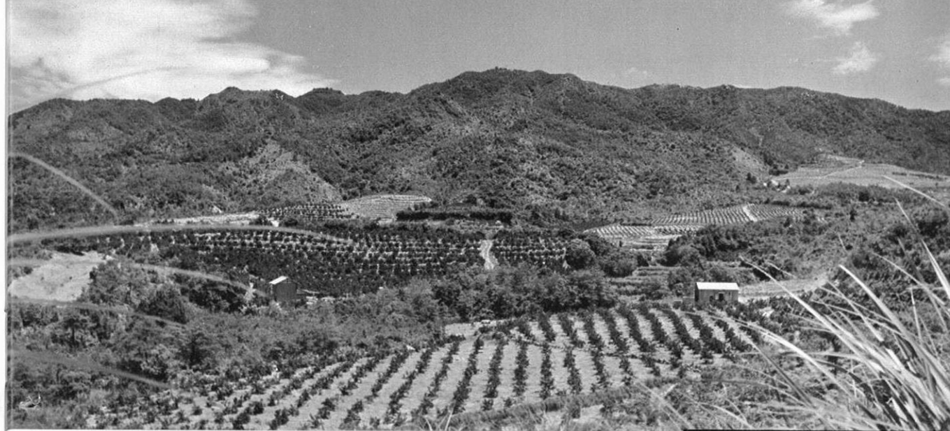
上・小岱山麓一帯に広がる新興みかん団地。