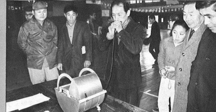
1.27 - 県民の体力向上をめざして、熊本県体力づくり巡回センターが各地でひらかれた。