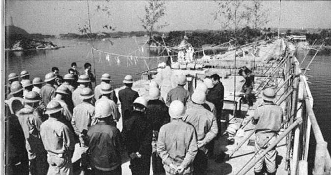
2.28 - 注目の天草架橋工事は順調に進み、この日四号橋の接合式が現場で行なわれた。