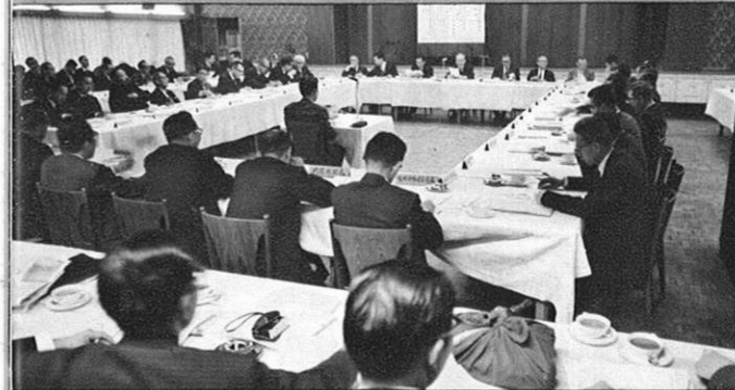
2.22 - 第2回九州地方行政連絡会議ひらく。(ホテルキャッスル)