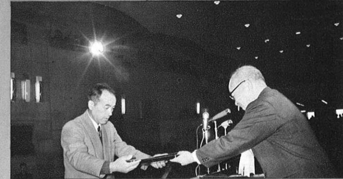
1.26 - 第16回県果樹大会ひらく。講演会、表彰などの行事で賑わった。(表彰状を渡す寺本知事)