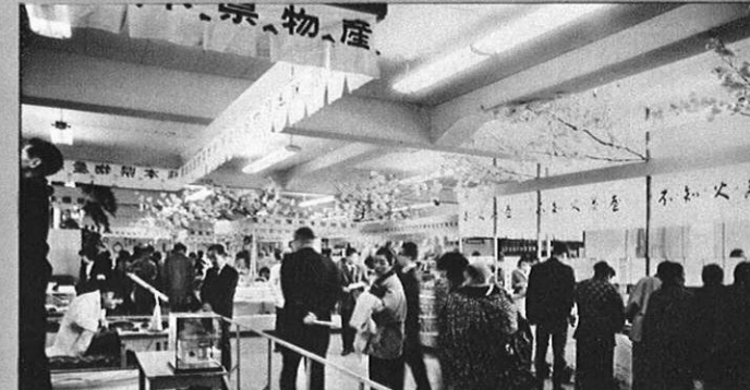
2.11 - 16 郷土のすぐれた特産品を集めて、今後の飛躍をめざして県物産総合展が催された。