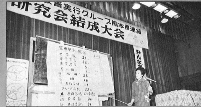
1.25 - 生活改善実行グループの県連絡研究会の結成大会を開催。今後の結束を誓い合った。