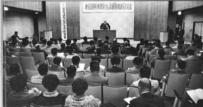
3. 1 - 県新生活運動協議会で新生活運動10周年を記念して講演会が……(県福祉会館ホール)