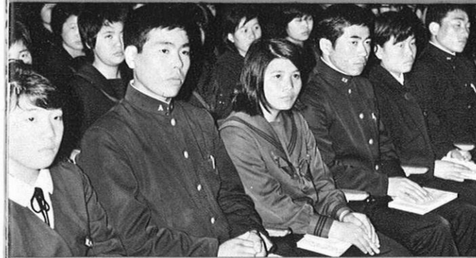
2.21 - 新しく農高、伝習農場を卒業した人、自営農者など1,500名が参会して盛大に激励会が……。