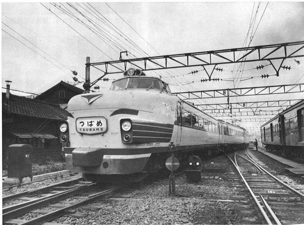
鹿児島本線の複線化電化も本格的に(写真は最近電化開通した熊本駅)