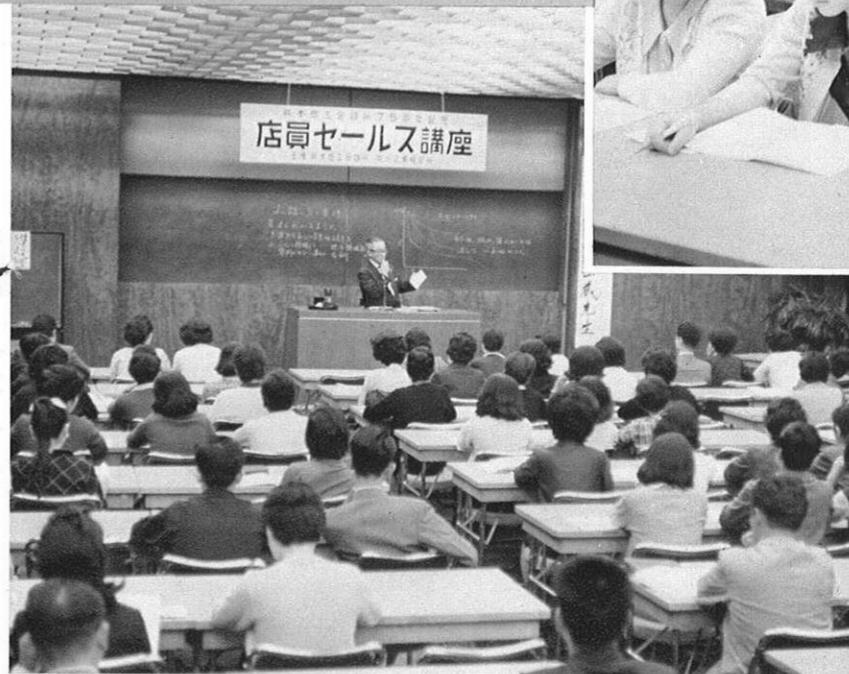
上・商店の従業員のための講習会