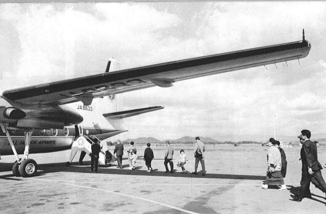
空路による観光客もふえてきた(熊本空港)

観光開発のための基盤整備として、輸送施設の整備は重要な課題だ。さきの、九州横断道路の開通、国鉄複線化、電化の促進、空路の拡張強化などにより、主要観光地を結ぶルートはさらに発展していくことになる。