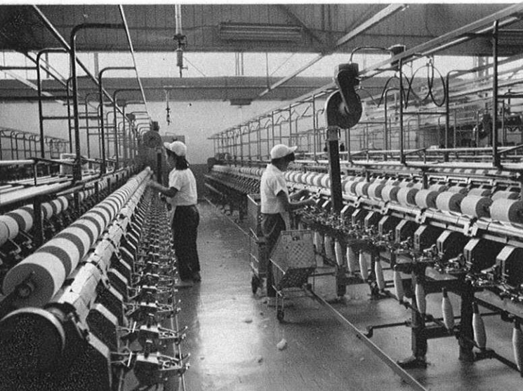
上・チリひとつない明るい職場環境（熊本市内の紡績工場）