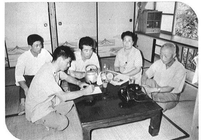
上・会場の模様は有線放送で各家庭へも中継された。