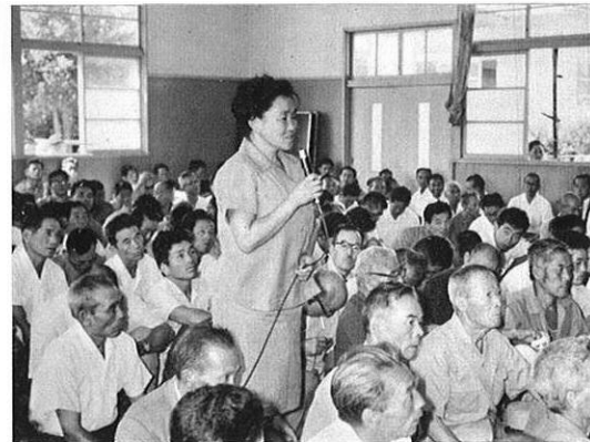
上・身近かな生活の問題も主婦の立場で…