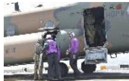
日米航空機への燃料補給・整備