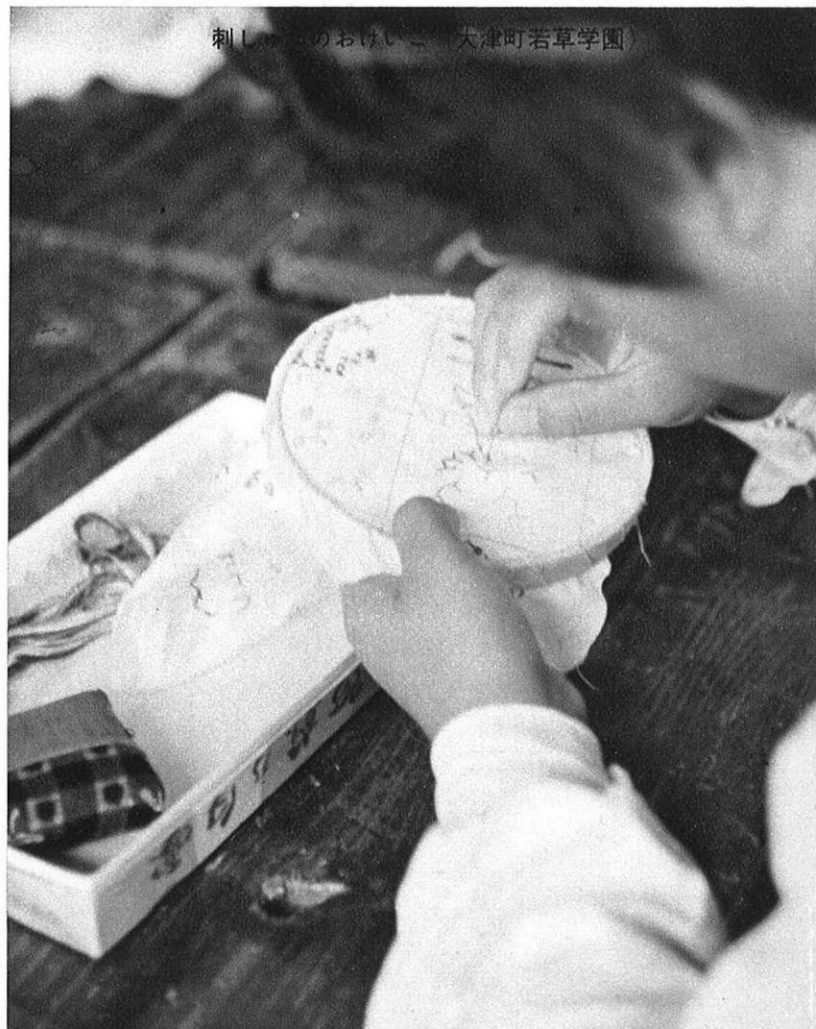
刺し子のあけいこ 大津町若草学園