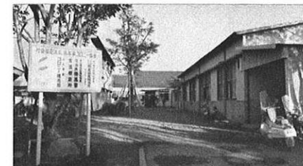
上・授産補導所全景

熊本市内にある身体障害者のための授産補導所(コロニー協会)。ここでは専門的な技能—タイプ、孔版、写真植字等を身につける便宜がはかれ、みっちり実技訓練が行われている。