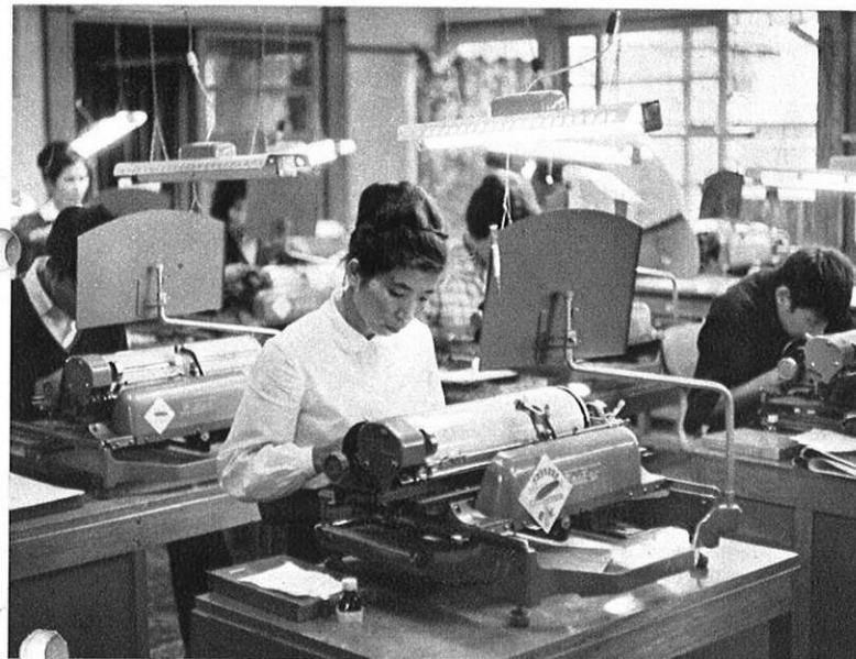
上・その日のために…技を磨くことにすべてがかけられる