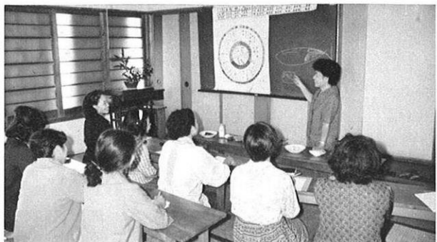
婦人寮に入って技能と教養をたかめている婦人たち