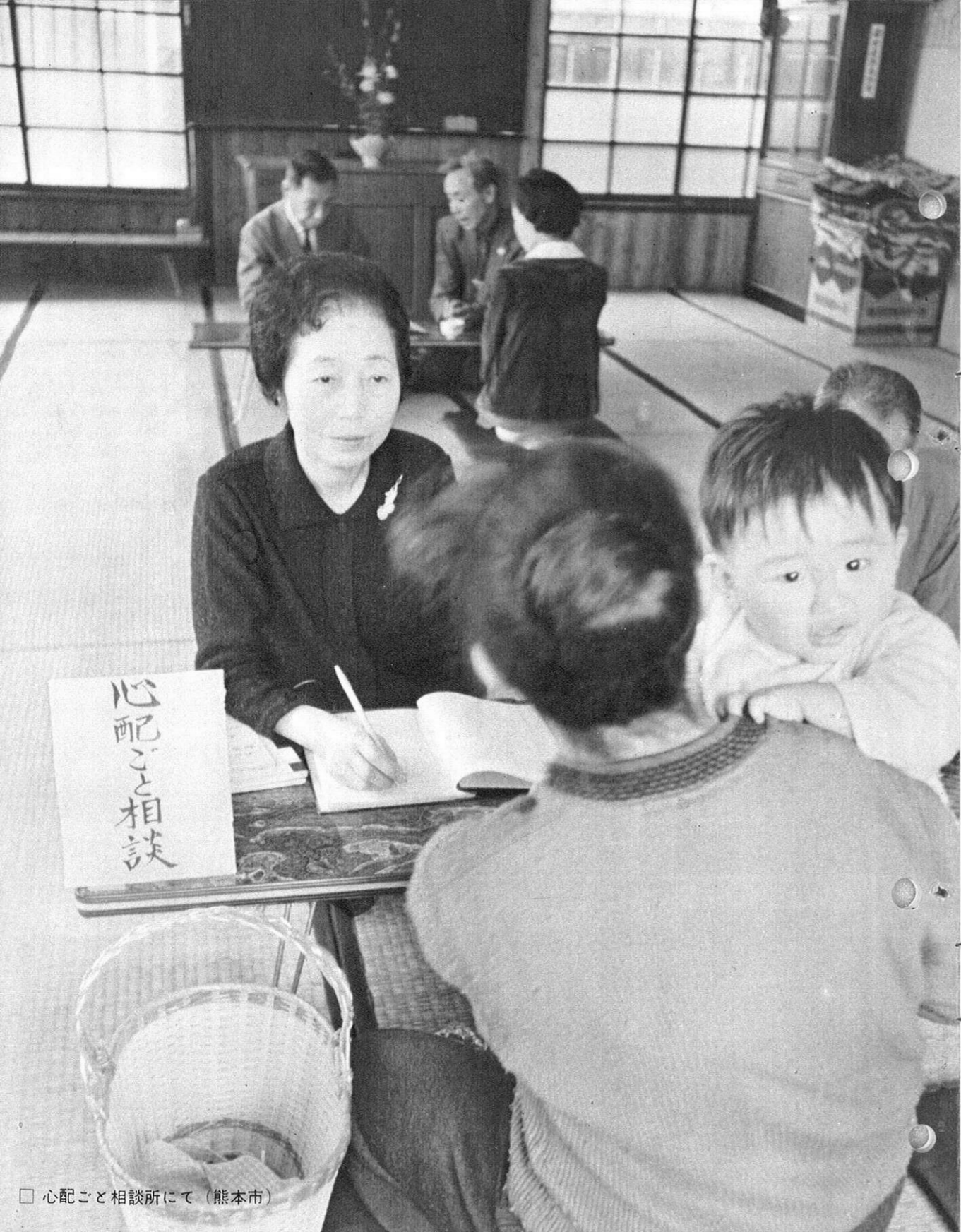
心配ごと相談所にて(熊本市)

昨年年度競輪等による盗金千四百四万円が、光明童園、菊水学園、牛深老人ホーム、熊本コロニー協会の増改築近代化に導入され、本年も期待されているが、その各都道府県配分に当たっては、県の共同募金額がその基準となっていることと思いを致し本年度運動の成功を一層念願するものである。 (県共同募金会)