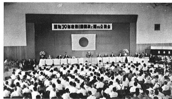
(8.22) 今年初の1日内閣が熊本で開かれた。国政・県政上に大きな成果を残した。