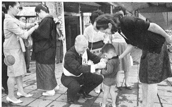
(10.1) 赤い羽根募金はじまる。熊本空港にとどいた赤い羽根は、早速、知事はじめ関係者によって街頭へ。