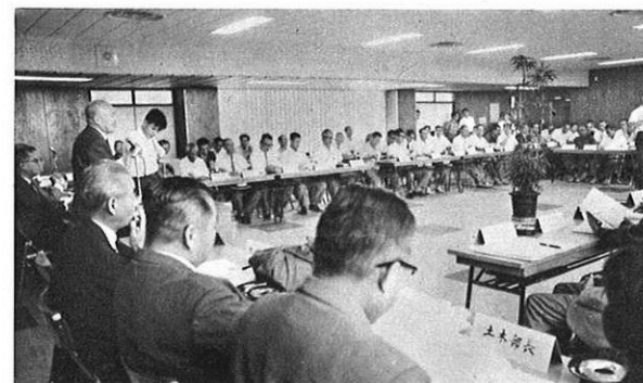
(8.31) 第1回市町村長議会開催。県政と市町村政を直結する有意義な試みが成功。

けんせいはいらいと・KENSEI HAIRAITO・ケンセイハイライト・県政ハイライト