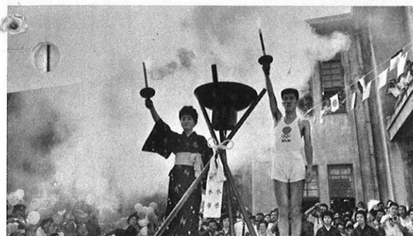
(9.11~13) オリンピック聖火、県下をリレー。沿道の熱狂的な観迎の中に、聖火は肥後路を通過した。沖縄からの火も、熊本で合流。