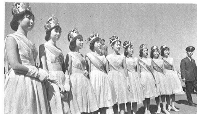
■秋晴れの高原でひととき映ゆるミス九州横断道路