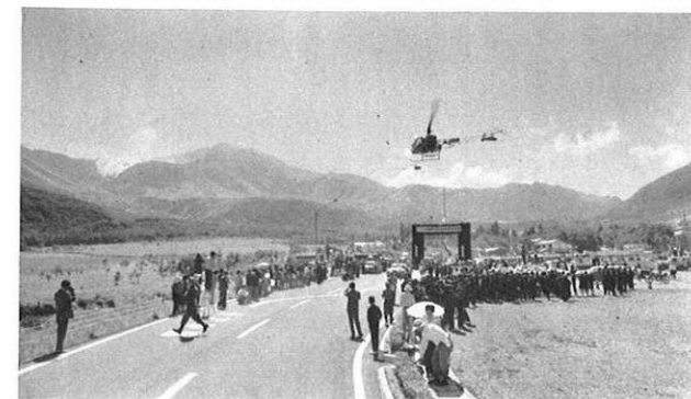
■空からと陸から、報道陣の活動もはなやかに