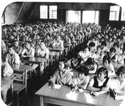
大講堂での受講、ディスカッションも活潑だ。