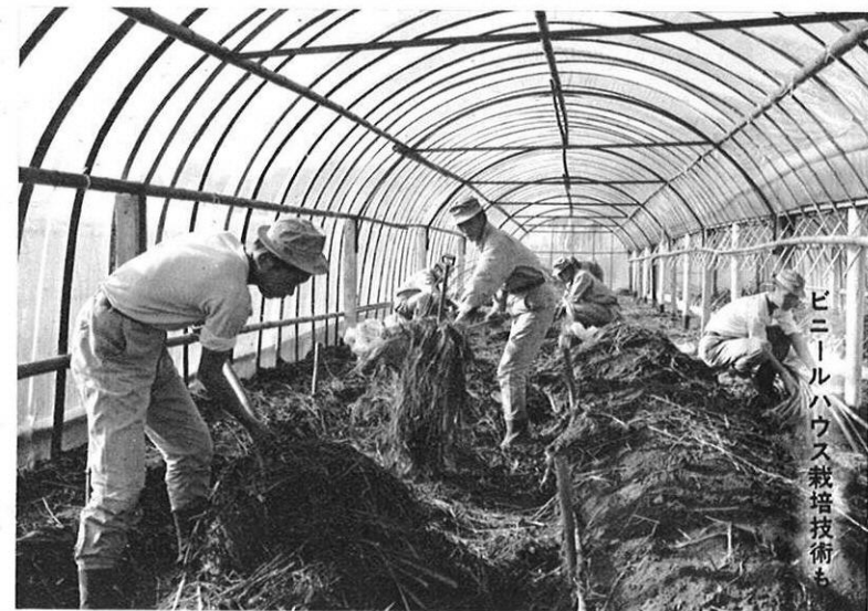
ビニールハウス栽培技術も