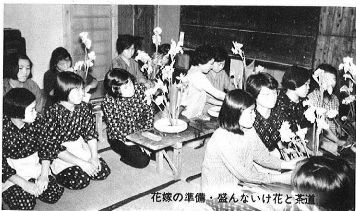
花嫁の準備・盛んないけ花と茶道