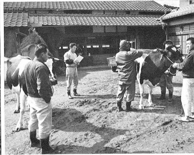
会員の家畜の検査もみんなで