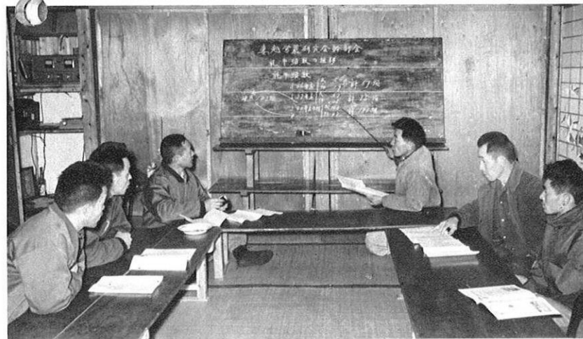
上・月1回の会の幹部会・グループ研究や実習の計画がわられる。

旭志村の妻越営農研究会では、営農の合理化と生活水準の引き上げを目標に、実習活動や、相互研究に予念がない。37年度には農業経営コンクールで農林大臣賞と知事賞を獲得したほどだが、28名の会員の結びつきは、いよいよ固い。