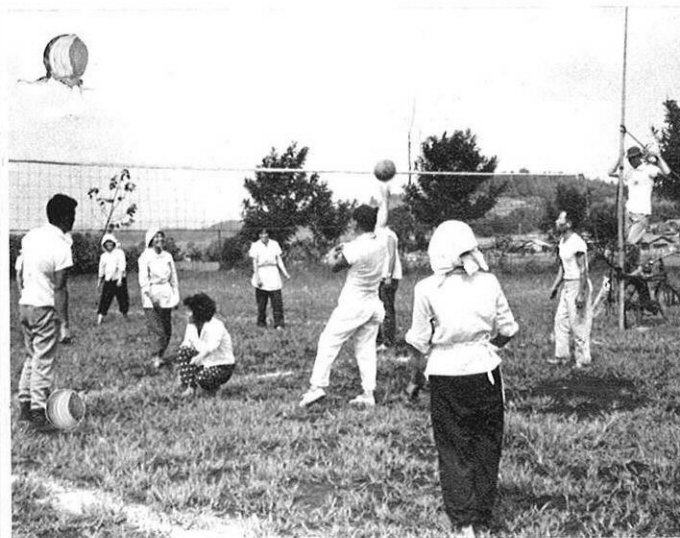
上・グループ活動の一環として、バレーボールやソフトボールの試合も活発だ。

旭志村の妻越営農研究会では、営農の合理化と生活水準の引き上げを目標に、実習活動や、相互研究に予念がない。37年度には農業経営コンクールで農林大臣賞と知事賞を獲得したほどだが、28名の会員の結びつきは、いよいよ固い。