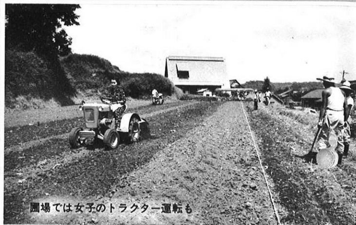
圃場では女子のトラクター運転も

ことしも170名の自営農業者が送り出される。菊池市にあるこの農場では、農業の近代経営の実習と研究活動に力こぶが入れられているが、近年、入所希望者が激増してきている。