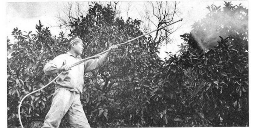
□ 貿易自由化にうちかつ近代果樹を... 飽託郡河内芳野村の杉本建雄君