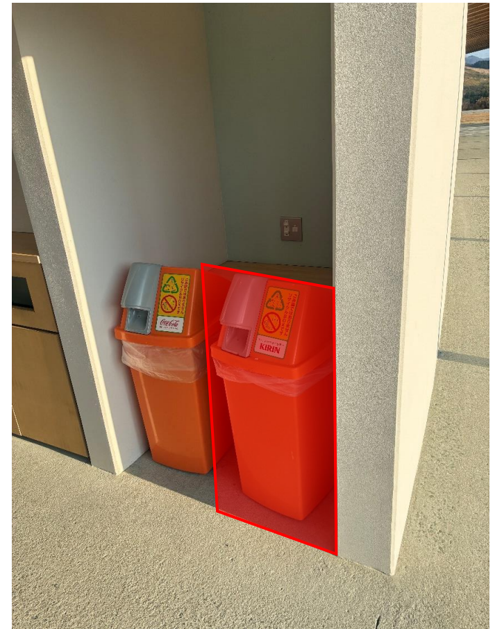
回収ボックス置場