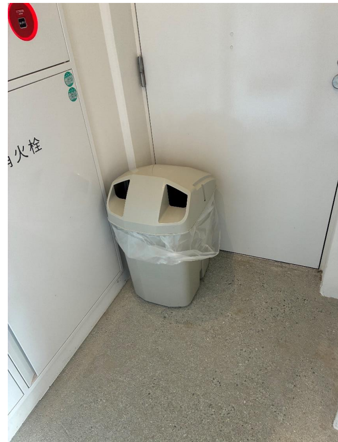
回収ボックス置場