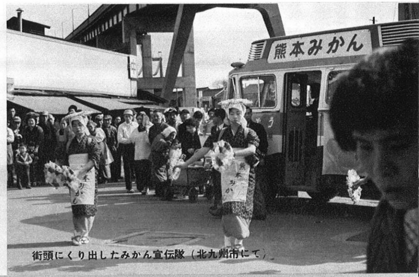
街頭にくり出したみかん宣伝隊（北九州市にて）