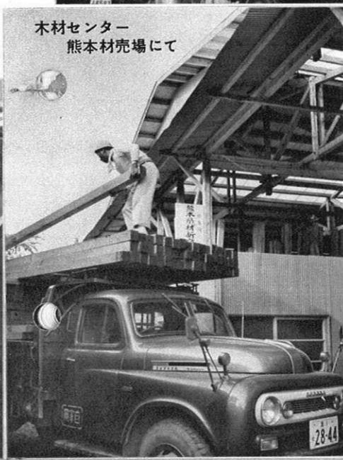
木材センター 熊本材売場にて