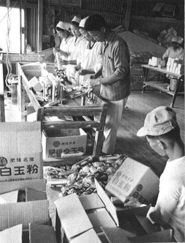
上・評判の白玉粉も設備の充実で、量産体制に入っている（小川町）