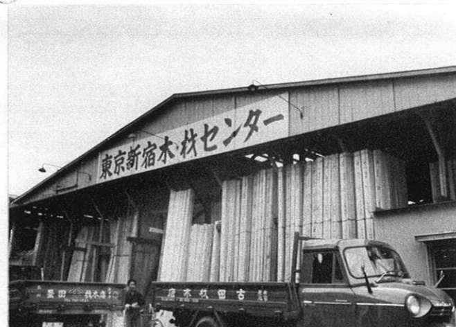
話題になった東京木材センターの全景