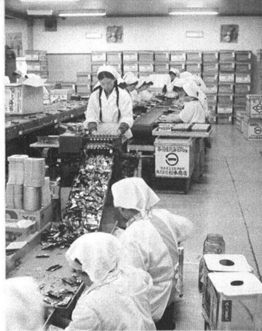
海苔加工場も近代化へ