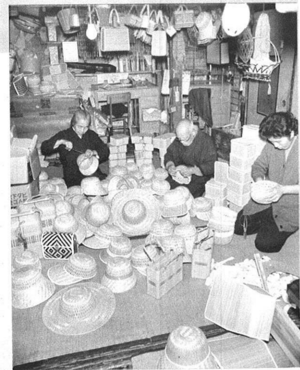
日奈久の竹製品工場