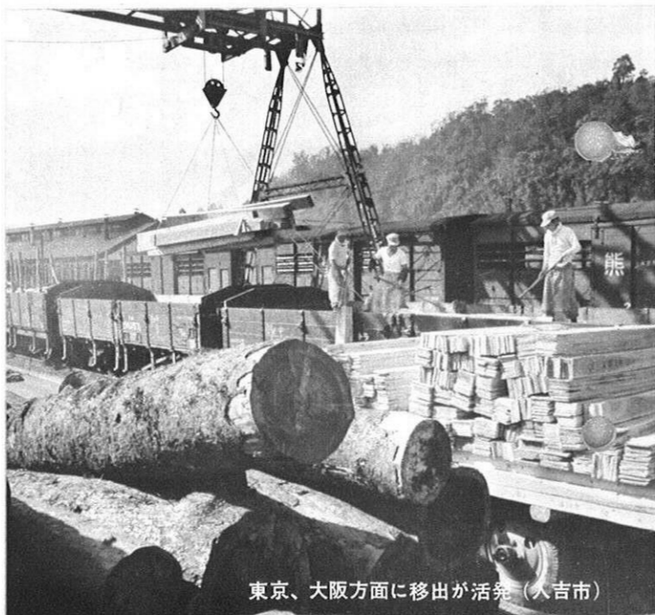
東京、大阪方面に移出が活発（入吉市）