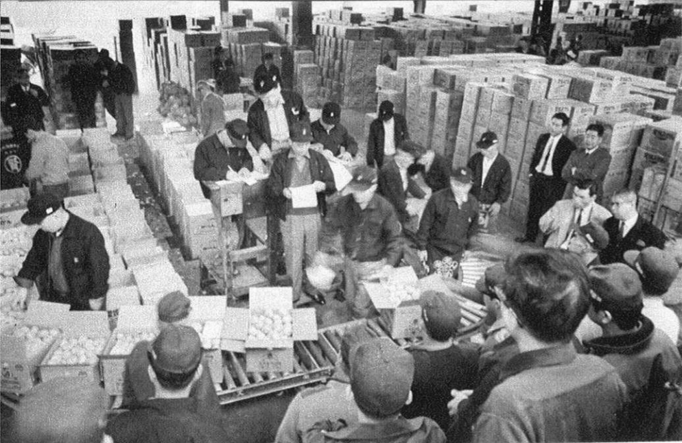
大がかりなみかんのセリ（大阪市場）