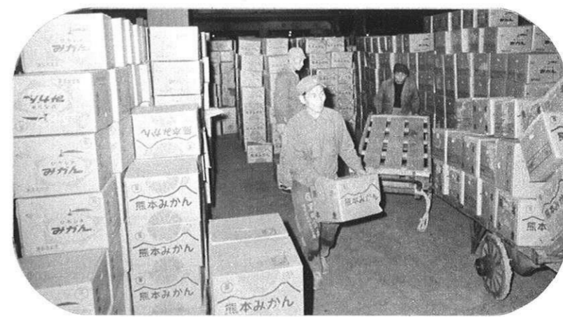
朝まだき、続々と熊本みかんが入荷（大阪市場）