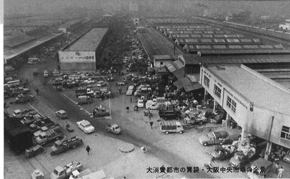
大消費都市の胃袋・大阪中央市場の全景