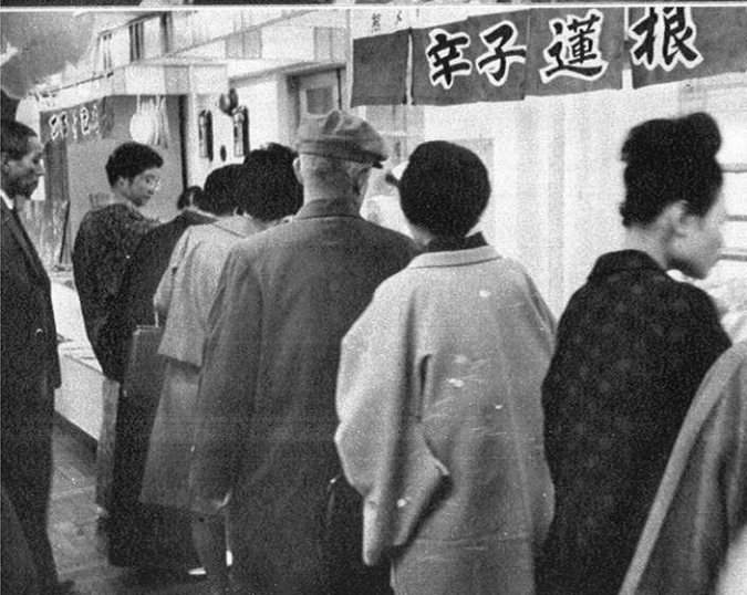
球磨焼酎はデパートがポスターをつくってPRを…