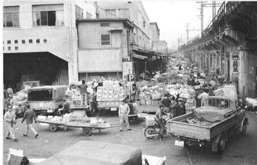
熊本みかんが集中販売されている東京神田青果市場