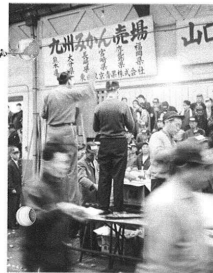
みかんのセリ（神田市場）