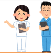
潜在看護師等 再就業支援研修