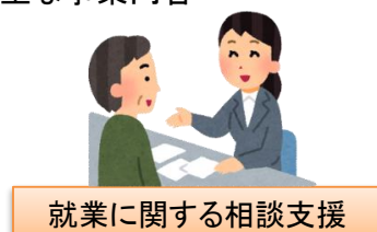
就業に関する相談支援