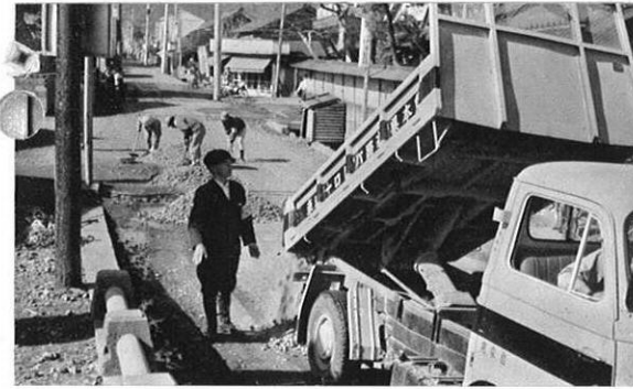
悪い力所には砂利を