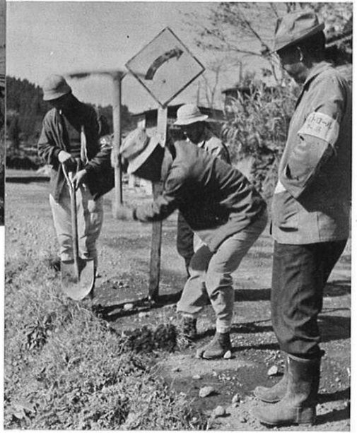
路傍の標識に細かい注意