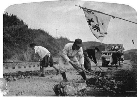
雨もよいの阿蘇路で、応急補修