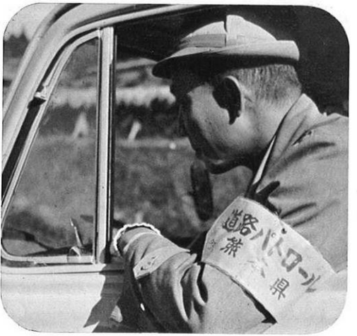
班長は車の上から路面の状況に目を光らす