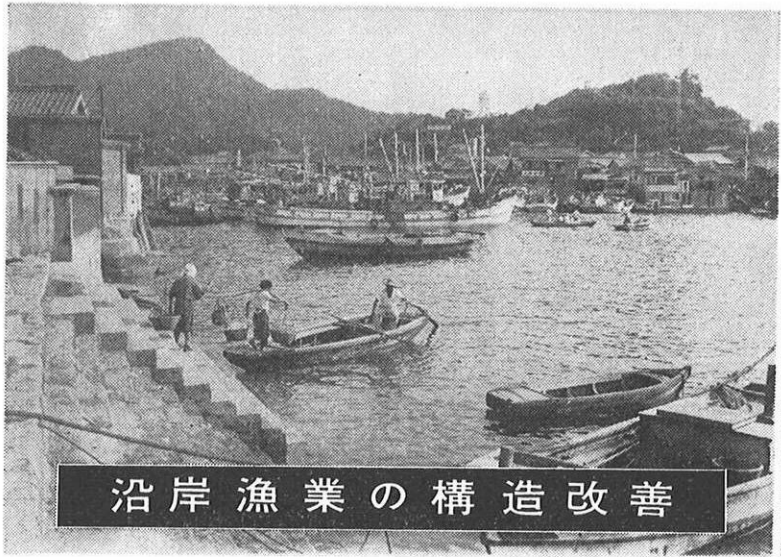
沿岸漁業の構造改善

沿岸漁業構造改善事業は漁業に従事する人たちの所得を、昭和四十八年までに、他産業に従事する人たちと均衡するまでに引き上げるため、いろいろな事業を行なおうというもの。この目的を達成することは容易なものではないが、県も漁業者の方々もともに真剣になって取り組んでいこうとしている。