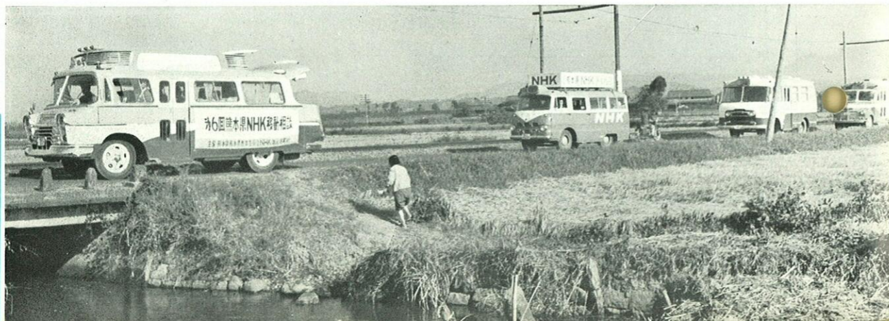
車をつらねて次の部落へ