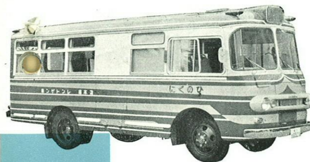
結核の早期発見に活躍する 県のレントゲン車