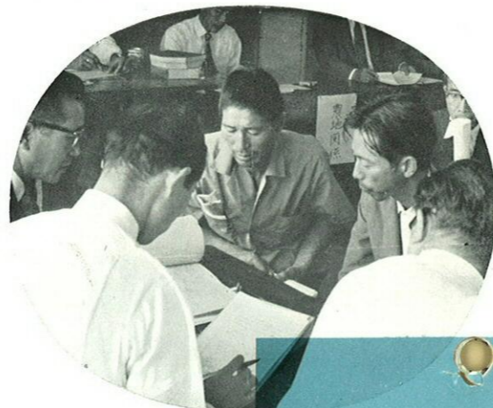
各部門にわたり 個別相談も……