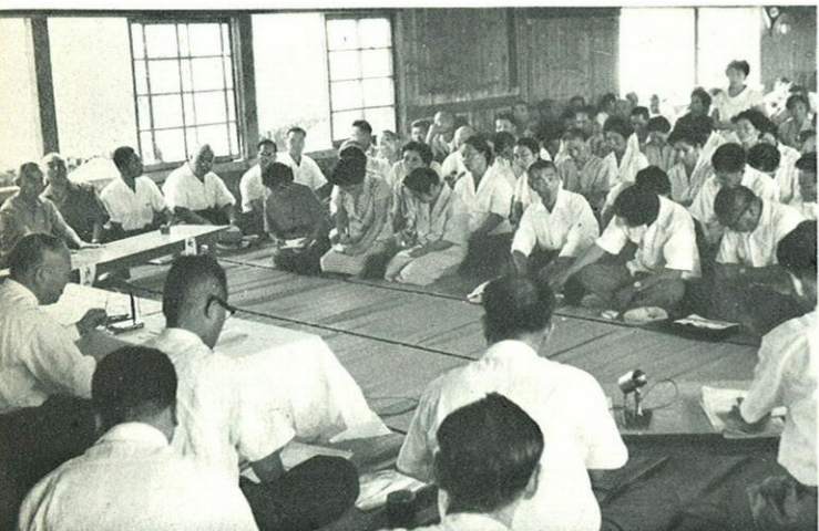
知事も現地の人々とひざを交えて……