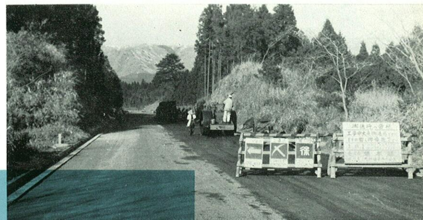
県政の重点として、道路の舗装改良には大いに力を注いでいる