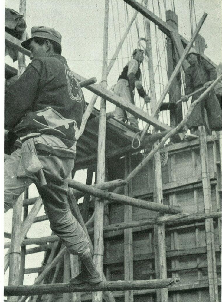
木上溝の石坂堰改築