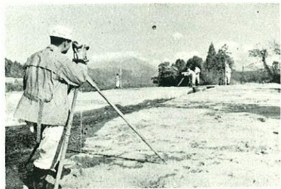
改築前の百太郎溝取水口附近