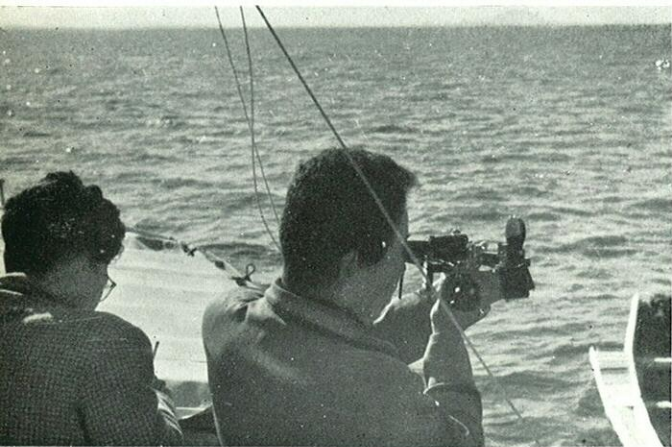
測量調査も慎重に……