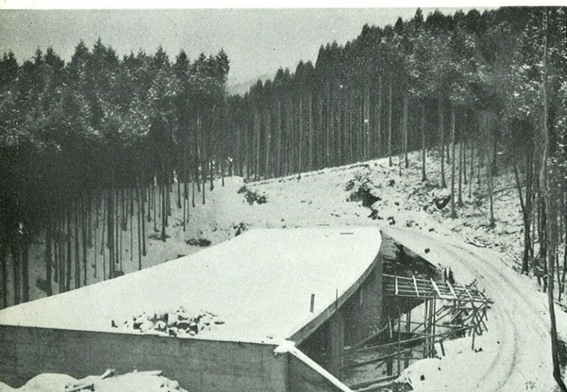
阿蘇独特の美しい杉木立をぬけて……