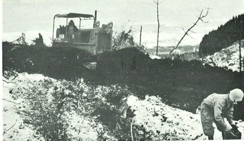
県境「牧の戸峠」の工事現場からは、遠く阿蘇五岳が望まれる