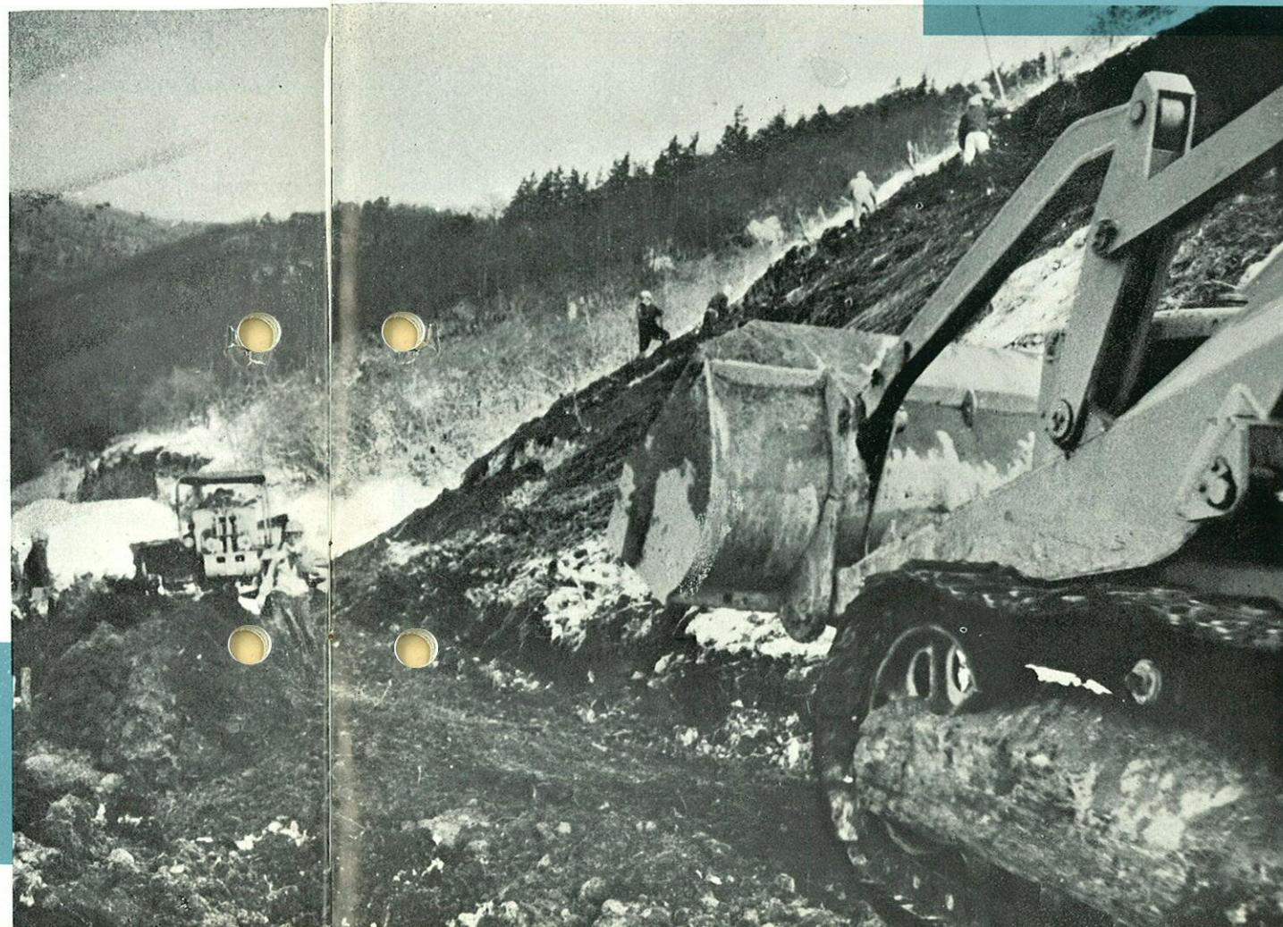
火山灰地帯という悪条件とたたかいながら……