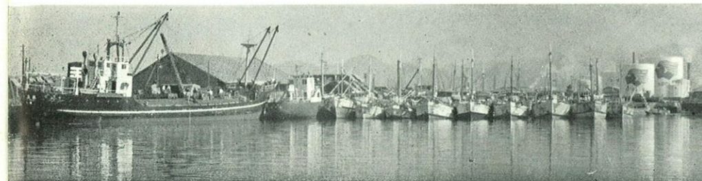
内港はこのにぎわい……これまでは輸送の大きな隘路となってきた

空からみた八代市一帯……右下は八代駅、左側を球磨川が流れて上方の不知火海に注いでいる。