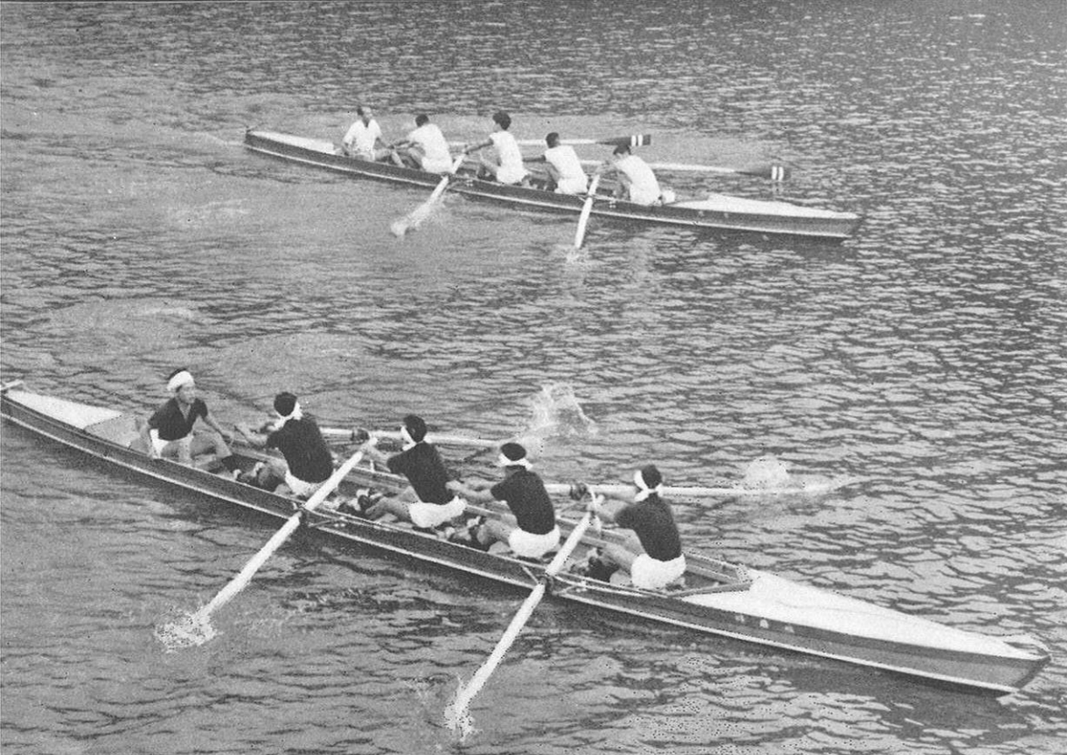
▲ 荒瀬ダムではカケ声も勇ましく漕艇練習 閉会式を飾る幼稚園のマスゲーム練習も……