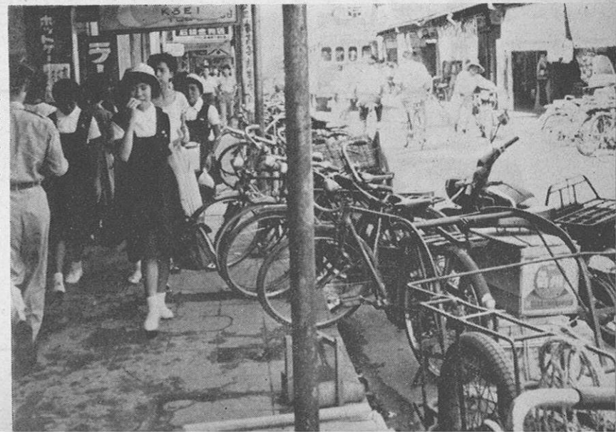
▶ 繁華街はこのありさま