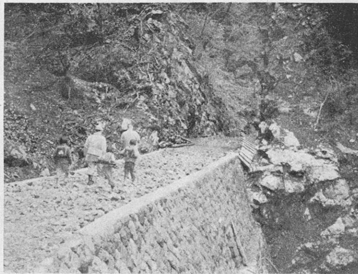
五家ノ荘にも立派な林道が完成

非常に歓迎されていますが、これまで県は財政上の都合からその資金枠をかなり窮屈に圧縮していました。本年度はこれを大巾に拡げることにして五千二百七十万円を計上しましたが、これによって、無利子の技術導入資金は一千五百万円、低利の施設資金は一億円の貸出額となりま