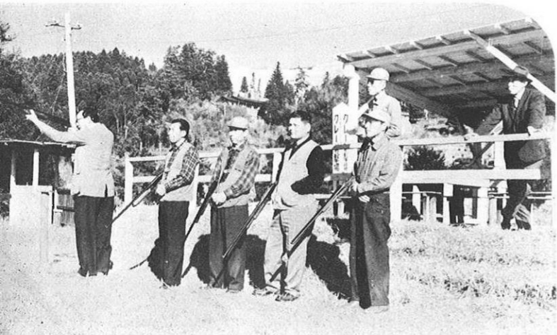
クレイ射撃の選手の皆さん