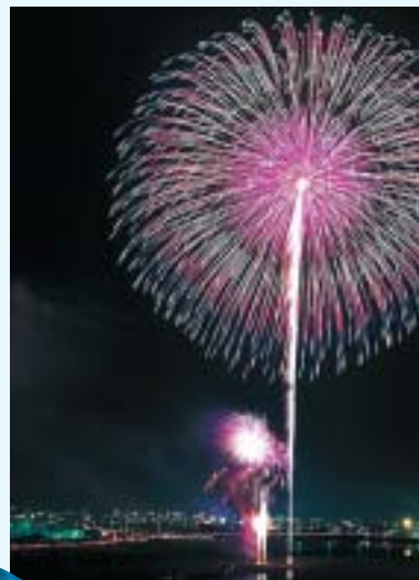
全国花火競技大会