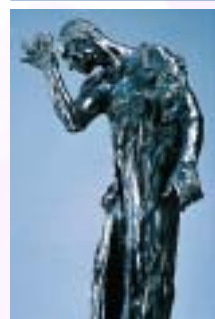
「カレーの市民」より

県立美術館本館(熊本市) ☎096-352-2111 http://www.pref.kumamoto.jp/institution/museum