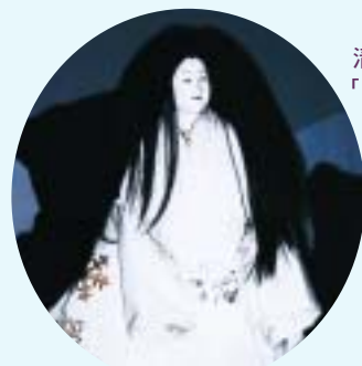
清和文楽 「雪おんな」

実施期間 / 10月26日(土)~11月4日(月) 実施場所 / 上益城地域の6町村の各会場