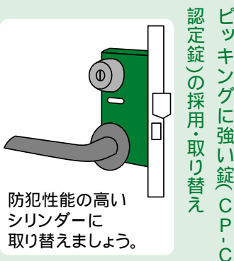
防犯性能の高いシリンダーに取り替えましょう。

熊本県内では、平成十二年は二十一件、平成十三年は十二件と、まだ少ない状況ですが、今後、犯行が増加する可能性も十分考えられます。ピッキング犯罪を防ぐためには、次のような方法が効果的です。