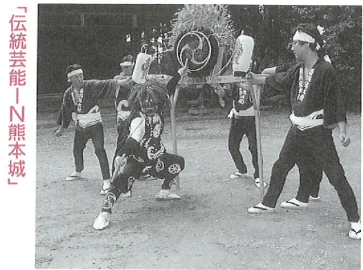
新潟県佐渡 鬼太鼓

十月八日(土)・九日(日) 11:00～13:00 県と友好関係にある中国、米国、韓国の民族舞踊を紹介します。