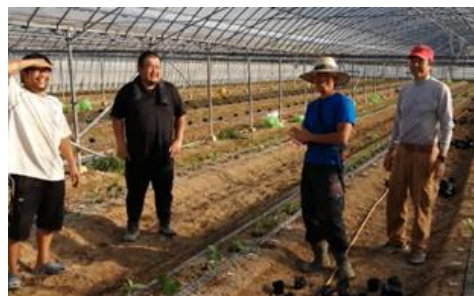
▲先輩農家によるサポート