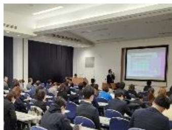
▲ペーパーティーチャー講習会