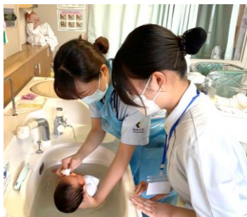
▲高校生の一日看護体験