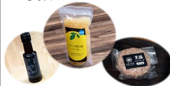
▲くまもと県南フードグランプリ受賞商品