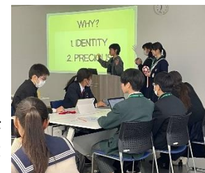
▲海外チャレンジ塾(英語でのプレゼン)