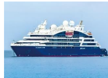
▲富裕層向けクルーズ船寄港・崎津を散策する欧米豪観光客