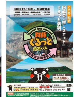
▲熊本観光MaaS (阿蘇ぐるっと周遊バス)