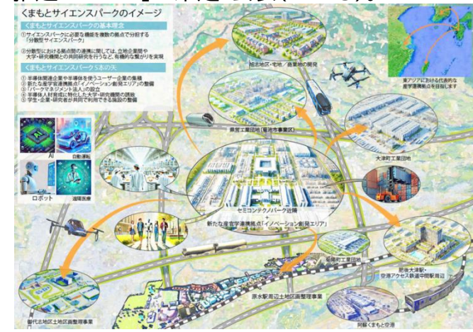
▲くまもとサイエンスパークのイメージ