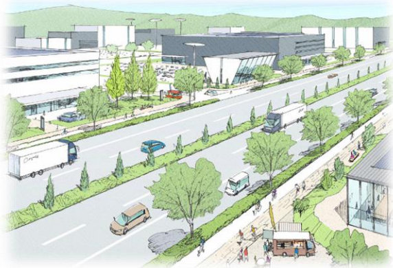
▲県道大津植木線多車線化イメージ