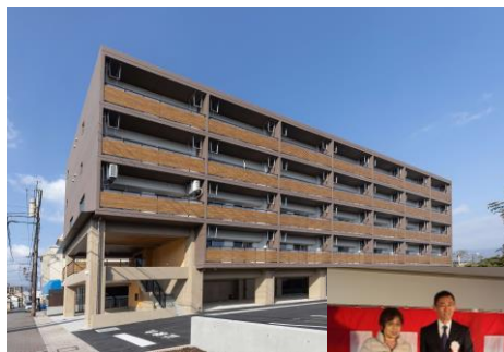
▲人吉市東校区災害公営住宅落成式(R7.2.28)