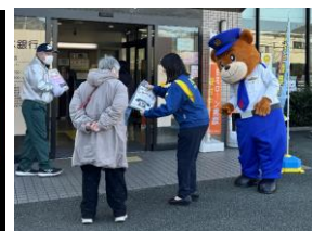
▲各種詐欺防止の呼びかけ