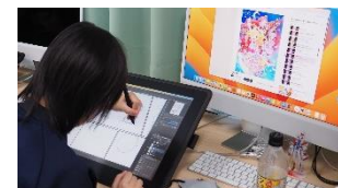
▲高森高校マンガ学科