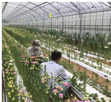
▲施設(農業用ハウス)の導入