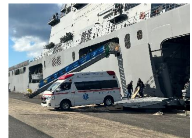
▲総合防災訓練の様子