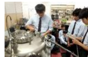
▲水俣高校半導体情報科