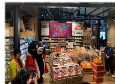
▲東京での県産農産物のPR