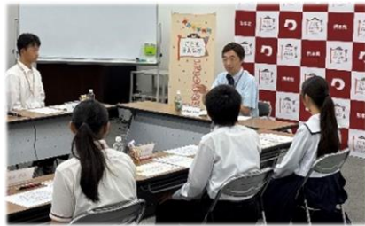
▲ こども未来創造会議(意見聴取)