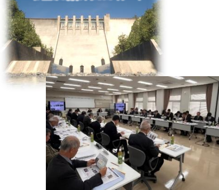
▲「ダムの事業の方向性・進捗を確認する仕組み」第3回会議 (R6.12.7)