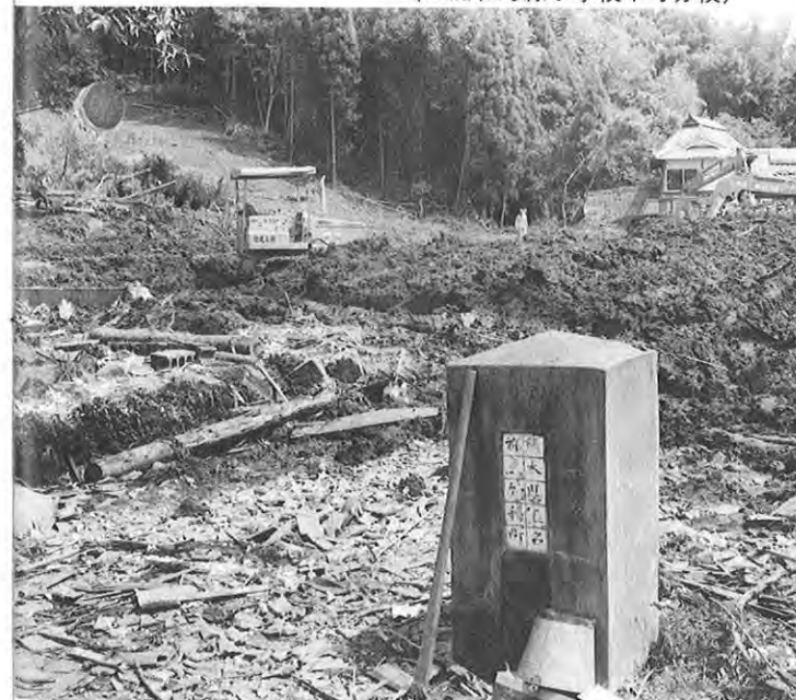
門柱だけを残して跡形もなく消えてしまった分校跡(三加和町緑小学校十町分校)

よび被害額は一億三千八百万円にのぼっています。 市町村立小学校では、三加和町立緑小学校十町分校のがけくずれによる全壊、鹿本町立中富小学校、球磨村立神瀬小学校、三加和町立神尾小学校の床上浸水等三十校におよび、被害額は二億円にのぼっています。 その他の教育施設では、田浦町民グラウンド、山鹿市民スポーツセンターの土砂流失等八箇所被害額は九千三百万円にのぼっています。 文化財では、熊本城跡、宇土城跡、人吉城跡の石垣損壊等四箇所、被害額は五千八百万円にのぼっています。 被害種別で見ると建物、工作物の被害は二億四千五百万円、土堤決壊、がけくずれ、土砂堆積等の被害額が四億円と土地関係の被害が被害総額の約六〇％となっております。 県教育委員会では、各関係機関と緊密な連絡をとりながら、この施設復旧について予算措置を講じ早期に工事を完了するよう努力を続けています。