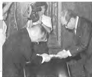
全国各地からの義援金は、8月23日被災市町村に伝達されました。(知事応接室)

今回の災害に際して、その被害が甚大であった事により、いち早く、天皇皇后両陛下から災害お見舞いとして御下賜金を賜りました。 また全国各地はもとより海外同胞からも、多数の方々から温かい義援金・義援物資が県に送られて参りました。これら善意の金品は関係者のご意見をお聞きし、早急に被災された方々にお届けするよう第一回分として六千五百六十七万五千二百八十二円を五十四市町村の代表者に伝達しました。お見舞いをお寄せいただいた方々に対し、厚くお礼申し上げます。 ご寄贈者ご芳名(昭和五十七年八月三十一日受付分まで) 一、義援金 総額九千八百八十三万三千六百四十七円(別紙名簿) 二、義援物資 贈呈者 品名 資生堂熊本販売株式会社 石鹸 NHK熊本放送局 タオル 株式会社寿屋本部 毛布 日本プロクター・アンド・ギャンブル株式会社 紙オムツ サントリ株式会社 Tシャツ その他二十九団体から百五十七個、四百六十八人の方々から五百七十六個の救援物資をお贈りいただきました。