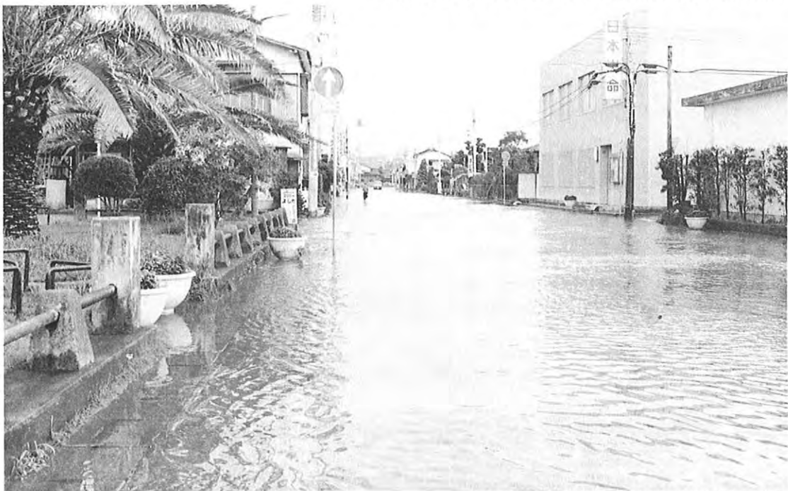
▲ 水浸しとなった宇土市役所付近 (宇土市)