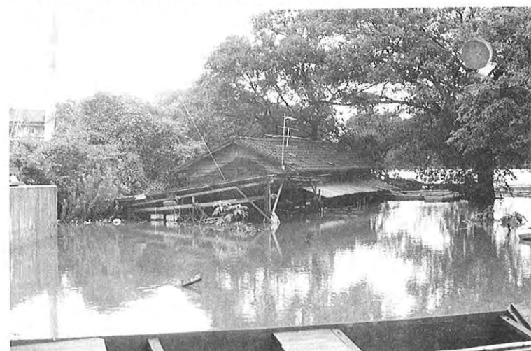
▲ 増水で軒先まで水につかった江津湖畔の民家 (熊本市)