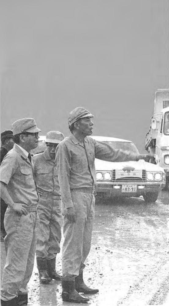
▲ 現地を視察する調査団 (田浦町)