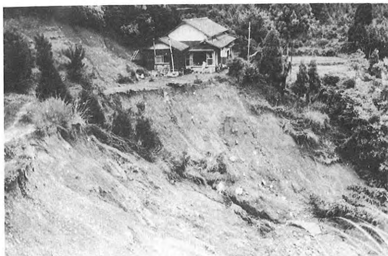
▲ “間一髪”で難をまぬがれた民家 (松島町)